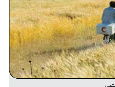
فیلم «باد ما را خواهد برد» ساخته عباس کیارستمی

ماندگاری تبدیل شدند. این درحالی‌است که در سال-های اخیر سینمای ایران‌تانی، ما را از طبیعت دور کرده است و آثاری که بتوانند راوی درست پیرامون باشند، یا به‌ندرت تولید می‌شوند، یا در پخش بسیار کم‌هزینه ظاهر شده‌اند. برای مثال فیلمی همچون «کشتزارهای سپید» که در دریاچه ارومیه فیلمبرداری شده است و اثری خوب در سینما به‌شمار می‌رود، یکی از همان آثاری است که در پخش توفیق چندانی نیافته است! از دیگر سو، سینمای مستند با نیرویی قوی در بخش فنی و علمی توانسته جایگاه بسیار خوبی در بحث طبیعت و انسان پیدا کند. امروز مستندهای بسیاری ساخته شده‌اند که چالش‌های زیستی را به تصویر کشیده و سبب تفکر در مخاطب شده‌اند. مستندهایی که در جشنواره‌های خارجی توانسته‌اند نگاه منتقدان سرسخت را به خود جلب کنند و جوایز بسیاری را نیز با خود با ارمغان بیاورند. در کلام آخر، آنچه از آن به‌عنوان طبیعت‌گرایی در نمای بصری نام برده می‌شود، روایتی یکدست و بدون دخالت است که تنها طبیعت راوی آن باشد و بتوان رخدادها را کولونیک را در قابی شایسته به‌تصخیر تصویر درآورد. یافتن و ساختن چنین نگاهی آسان نیست و نیازمند تفکری مبتنی بر ساختارهای طبیعت است.