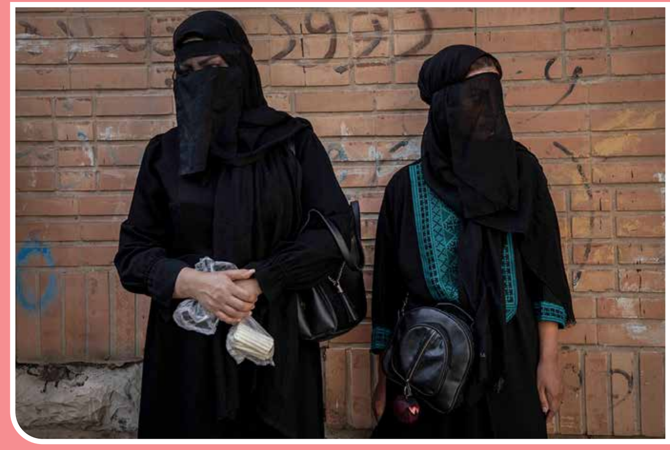
آیین سنتی چهل‌منبران در خرم‌آباد آیین «چهل‌منبر» رسمی دیرینه در میان بانوان لرستان است که همزمان با روز تاسوعا به یاد اسارت حضرت زینب (س) و اسرای دشت کربلا برگزار می‌شود و در جریان آن عزاداران با پای برهنه و نقاب بر چهره ۴۰ شمع را در ۴۰ سقاخانه به نیت برآورده شدن حاجات خود روشن می‌کنند.