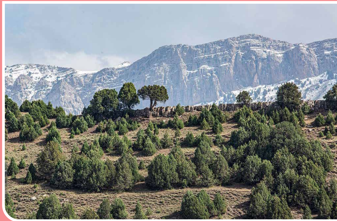
درخت ارس درخت ارس یا ورس یا سرو کوهی در مناطق کوهستانی و بیشتر در ارتفاعات بیش از ۲۰۰۰ متر می‌رود. این درخت عمر طولانی بیش از دو هزار سال دارد و در برابر بیماری‌ها و انگل‌های طبیعی و بسیار مقاوم است. درخت ارس به خاطر رشد اندکی که دارد، کمتر از یک میلی‌متر در سال رشد می‌کند.