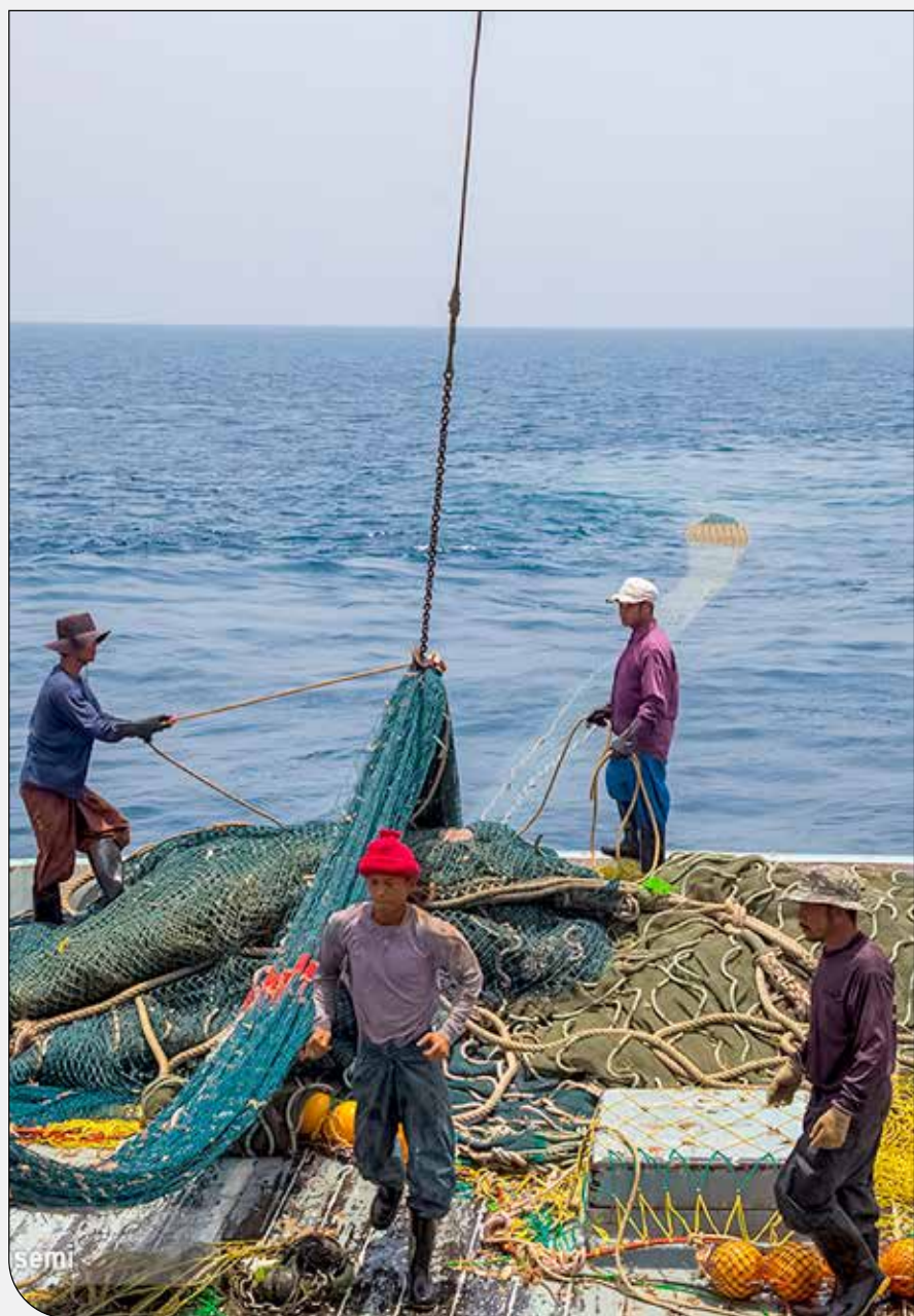
مجلس به دنبال اصلاح قانون حفاظت و بهره‌برداری از منابع آبی است