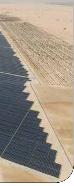
نیروگاه خورشیدی در استان فارس

وزیر نیرو از تهیه دستورالعمل صادرات برق نیروگاه‌های تجدیدپذیر در فصول غیر بیک مصرف خبر داد