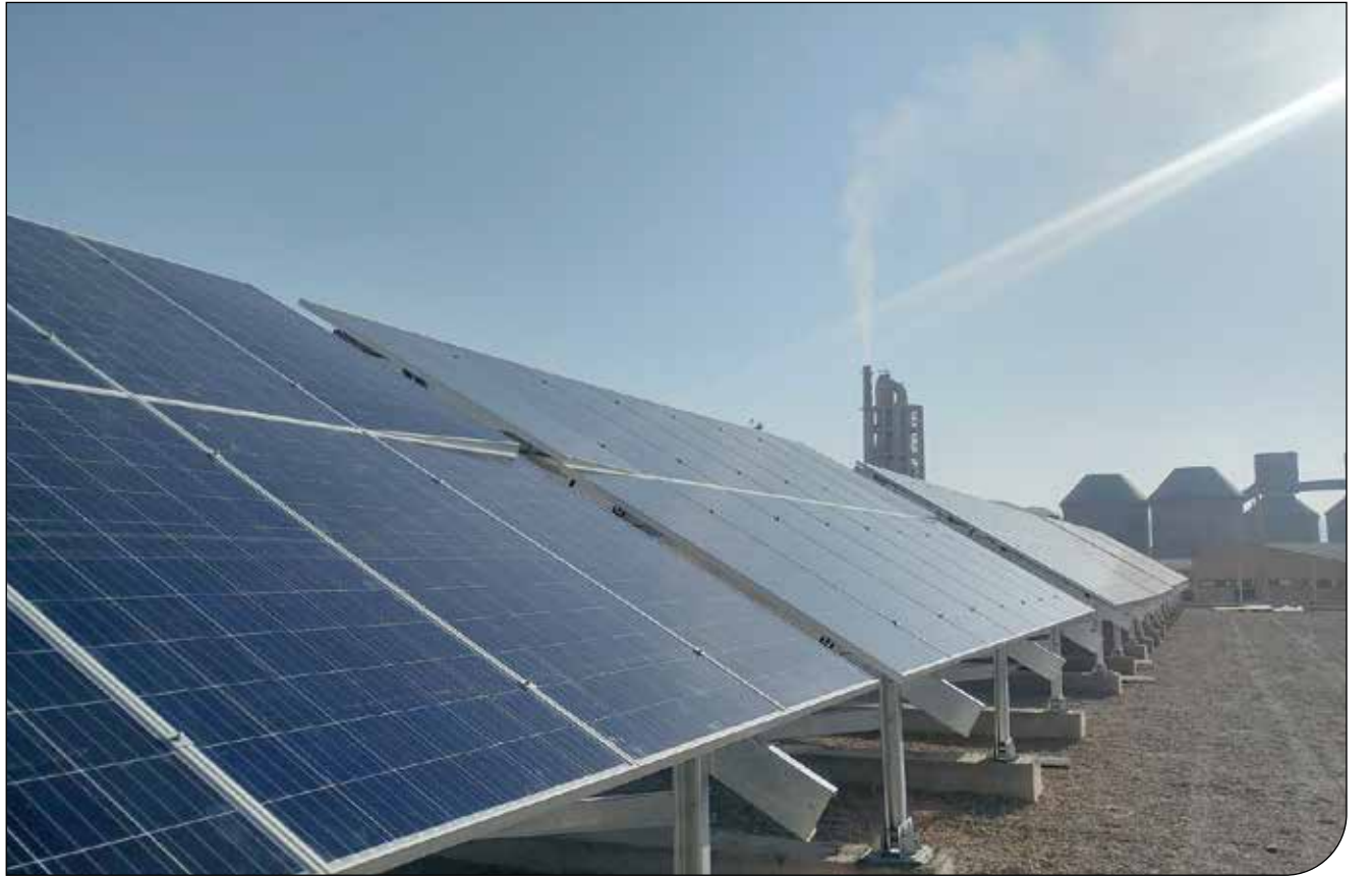
آژانس جهانی انرژی می‌گوید انرژی‌های تجدیدپذیر و انرژی هسته‌ای در سه سال آینده تقریباً تمام رشد تقاضای جهانی برق را تأمین خواهند کرد.

گزارش آژانس نشان می‌دهد که به دلیل استفاده از انرژی‌های تجدیدپذیر، افزایش تولید برق منجر به افزایش قابل توجه انتشار گازهای گلخانه‌ای نشده است