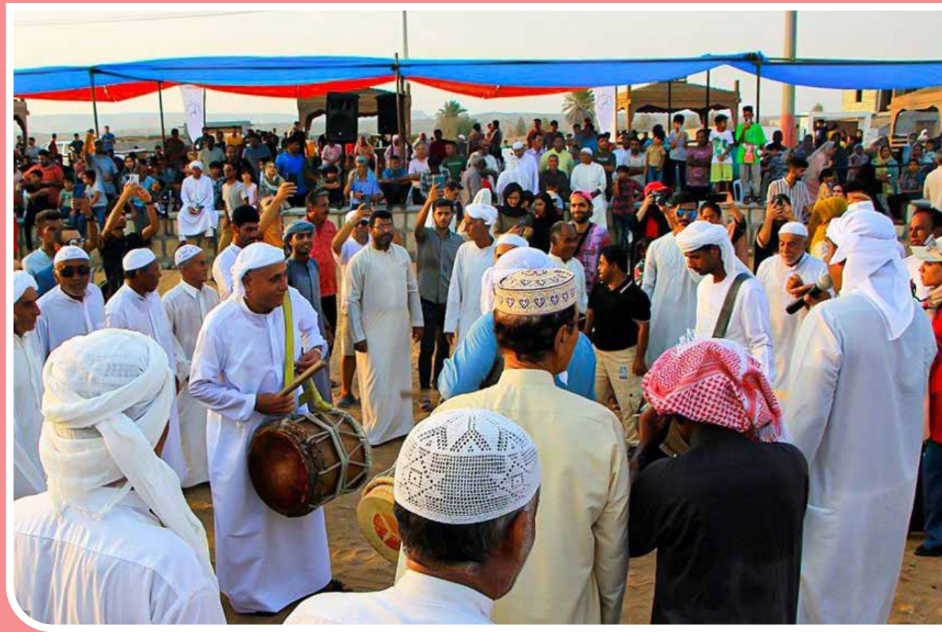
نوروز صیاد در «قشم» هفته پیاپی تیرماه و اوایل مرداد هر سال را نوروز صیاد می‌نامند. این روز، اولین روز از فصل گرمای واقعی است و معنی آن این است که یک سال صیادی چرخیده و فصل صید ماهی به پایان رسیده است. در روزهای منتهی به نوروز صیاد هیچ‌کدام از روستانشینان قشم، ماهی یا هر نوع آب‌زی دریایی دیگری صید نمی‌کنند و یا نمی‌خورند.