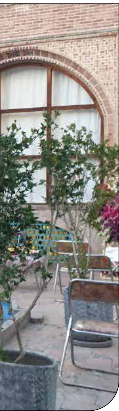
- ۳ - [۱۵]

عضو هیأت علمی پژوهشکده باستان‌شناسی همچنین اظهار امیدواری کرد اجرای این قبیل پروژه‌های عمرانی کم‌ترین لطمه را بر این طبیعت بکر و باستانی داشته باشد.