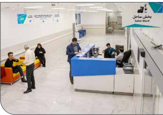
بخش ساحل Sahel Ward

معاون درمان وزارت بهداشت هم در این زمینه همایش با بیان اینکه اگر ۳۰ درصد تخت‌های بیمارستانی را به گردشگری سلامت اختصاص دهیم دست یافتن به هدف ۵ تا ۱۰ میلیارد دلاری غیرممکن نخواهد بود، گفت: «یک هزار و صد بیمارستان داریم که ۷۰۰ بیمارستان دولتی و مابقی خصوصی هستند، همچنین ۲۵۰ بیمارستان دارای مجوز IPD دارند و می‌توانند میزان بیماران بین المللی باشند. همچنین ۱۵۵ هزار تخت بیمارستانی داریم که ۱۶ هزار تخت طی دو سال اخیر اضافه شده است و دارای به روزترین امکانات و تجهیزات هستند.»