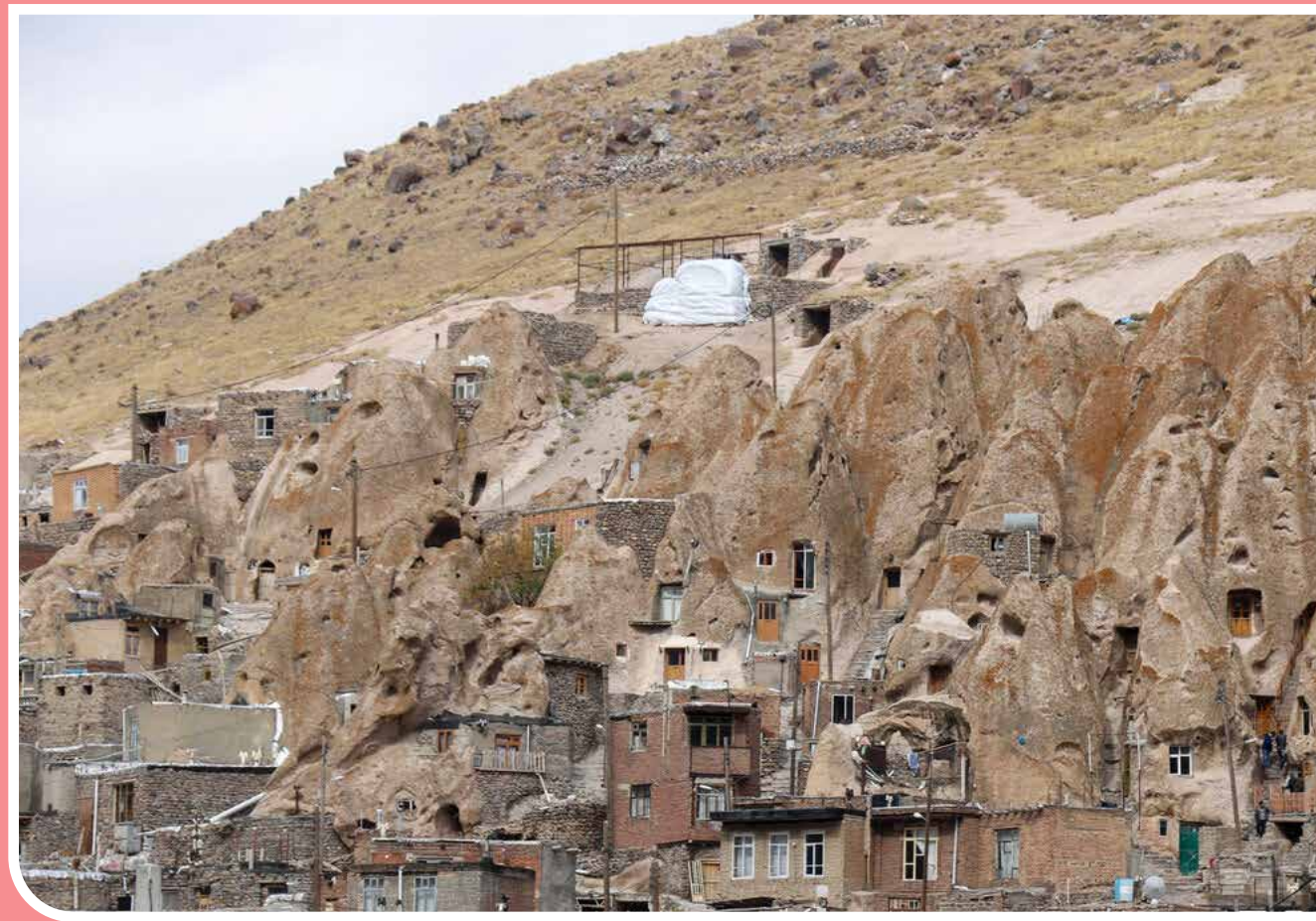
«کندوان» یکی از روستاهای استان آذربایجان شرقی واقع در شهرستان اسکو است که به دلیل معماری منحصر به فرد خانه‌هایش مورد توجه گردشگران است. روستای کندوان با آپارتمان‌های صخره‌ای هزارساله، از سوی سازمان جهانی گردشگری (UNWTO) به عنوان نخستین روستای ایران در فهرست بهترین روستاهای جهانی گردشگری ثبت شد.