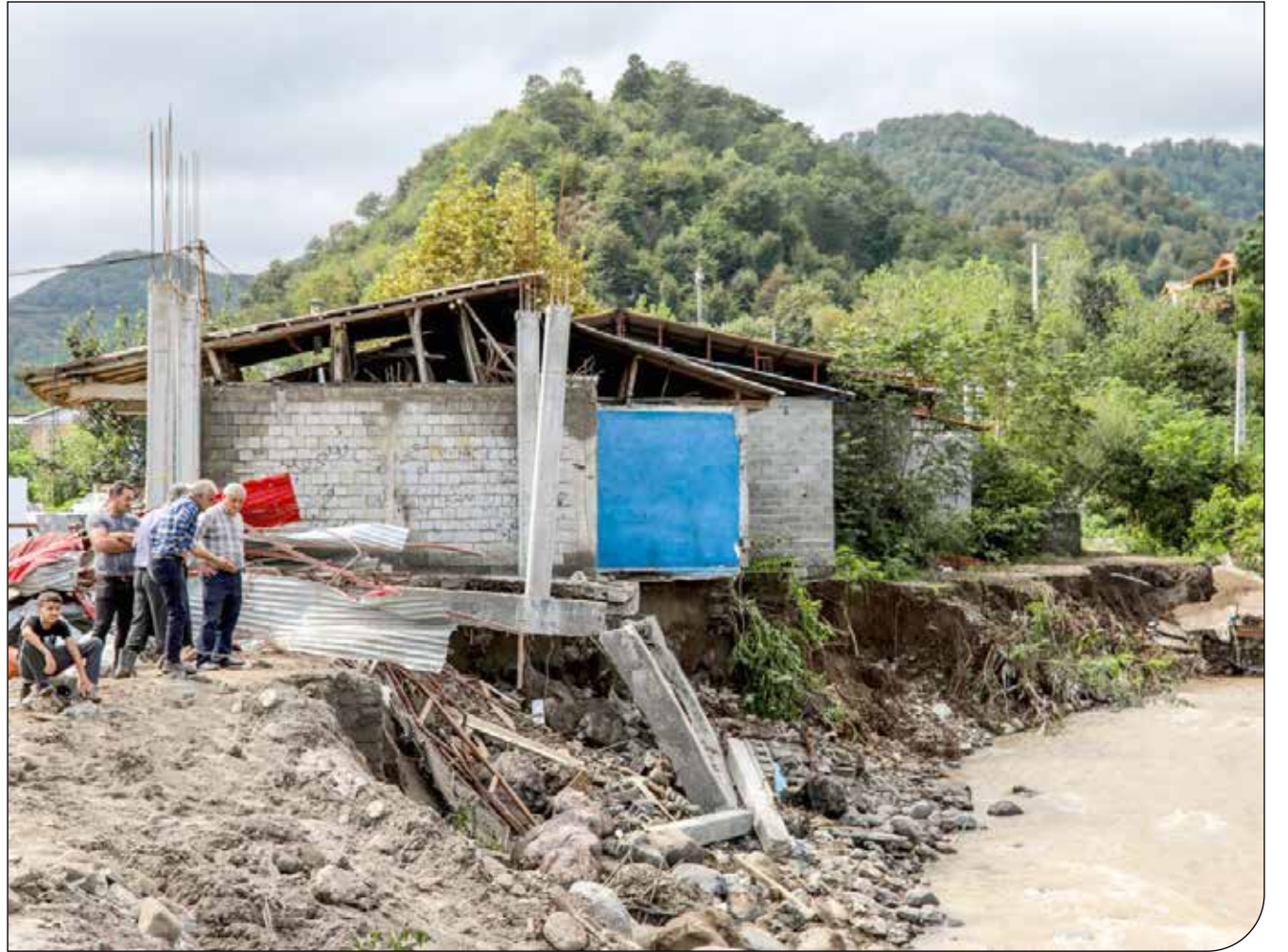
تخریب کامل یک ساختمان در اثر سیلاب در استان لرستان

فقط در سال ۱۳۹۸ مجموع خسارات وارد شده در اثر سیلاب استان‌های گلستان، لرستان و خوزستان حدود ۴۰۰ هزار میلیارد ریال برآورد شد، یعنی چهار برابر خسارت‌های ناشی از زمین لرزه سال ۱۳۹۶ کرمانشاه