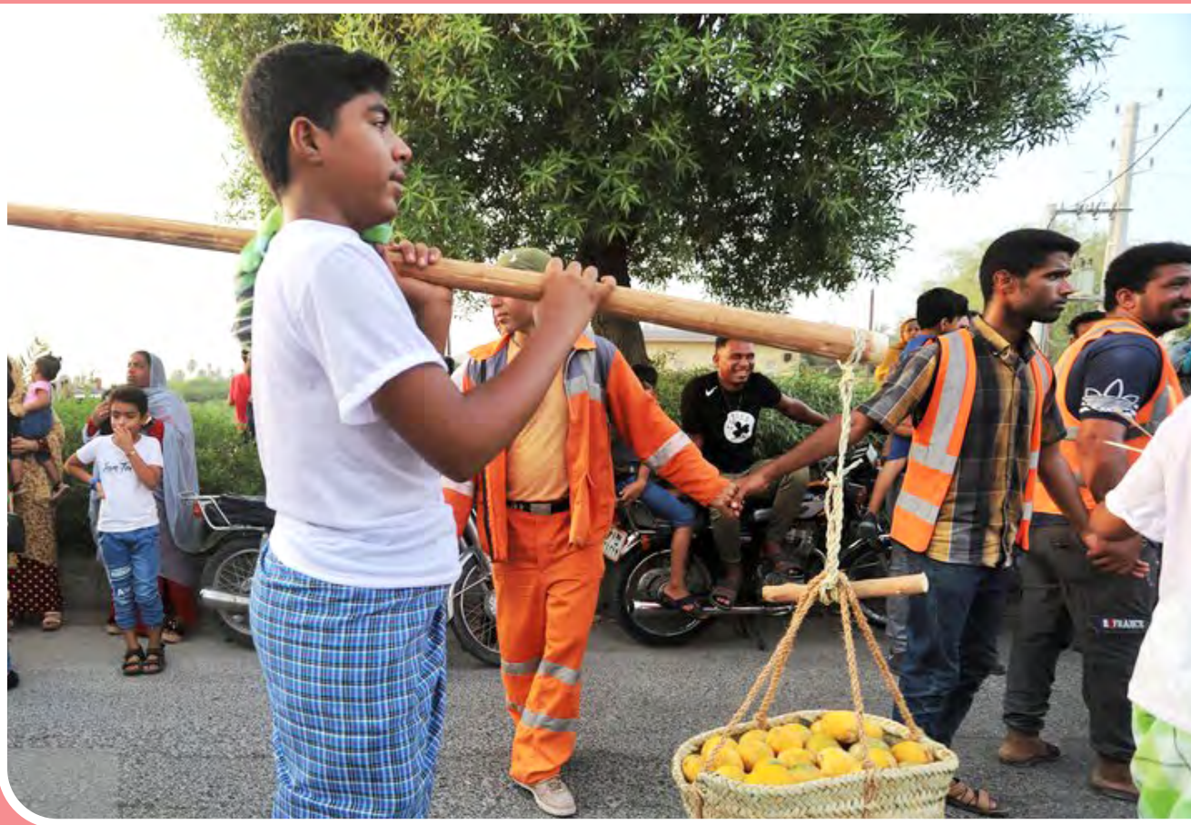
نهمین دوره جشنواره شکرگزاری انبه و یاسمین گل با شعار «میناب شهر شور و شادی» از ۱۳ تیرماه آغاز شد و تا ۱۵ تیرماه ادامه دارد.