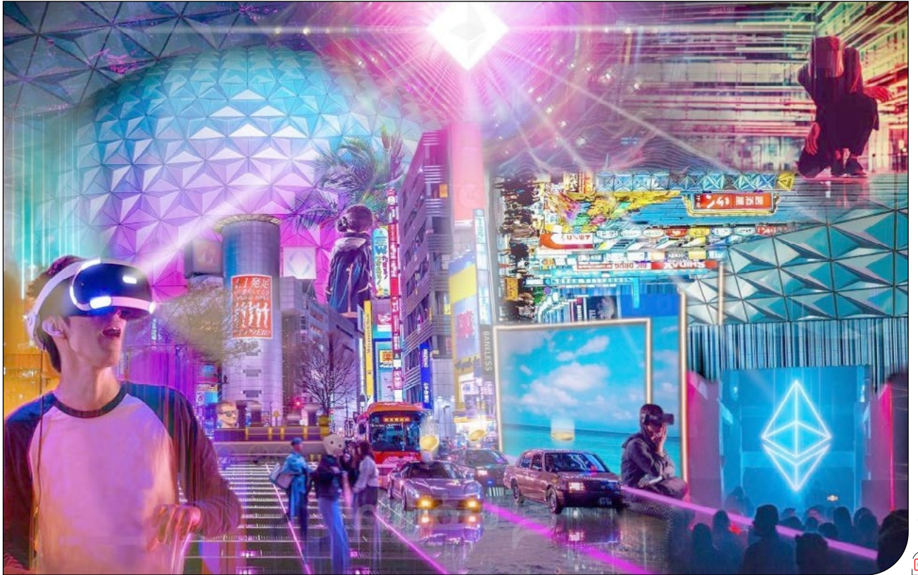
گردشگری «متاورس» همین حالا در جریان است