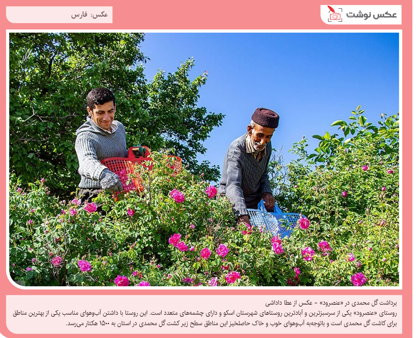
برداشت گل محمدی در «عنصرود» - روستای «عنصرود» یکی از سرسبزترین و آبادترین روستاهای شهرستان اسکو و دارای چشمه‌های متعدد است. این روستا با داشتن آب‌وهوای مناسب یکی از بهترین مناطق برای کاشت گل محمدی است و باتوجه به آب‌وهوای خوب و خاک حاصلخیز این مناطق سطح زیر کشت گل محمدی در استان به ۱۵۰۰ هکتار می‌رسد.