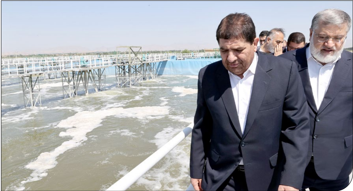
| President |