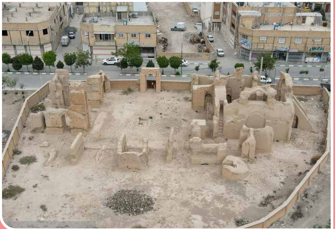
«هفتشویه»، مسجدی با قدمت سلجوقی - مسجد جامع «هفتشویه» در قرن پنجم قمری در ناحیه قناب در روستای هفتشویه استان اصفهان احداث شد. هر چند کتیبه تاریخ‌داری از این بنا باقی نمانده که بتوان قدمت دقیقی برای آن مشخص کرد، اما براساس اسناد موجود، این بنا حدود ۸۰۰ سال قدمت دارد. همچنین این مسجد، دو ایوانی بوده که برخی از بخش‌ها متعلق به دوره ایلخانی و برخی متعلق به دوره سلجوقی است.