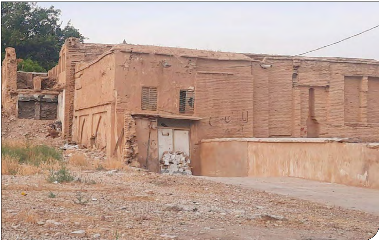
آبگرمی در شیراز