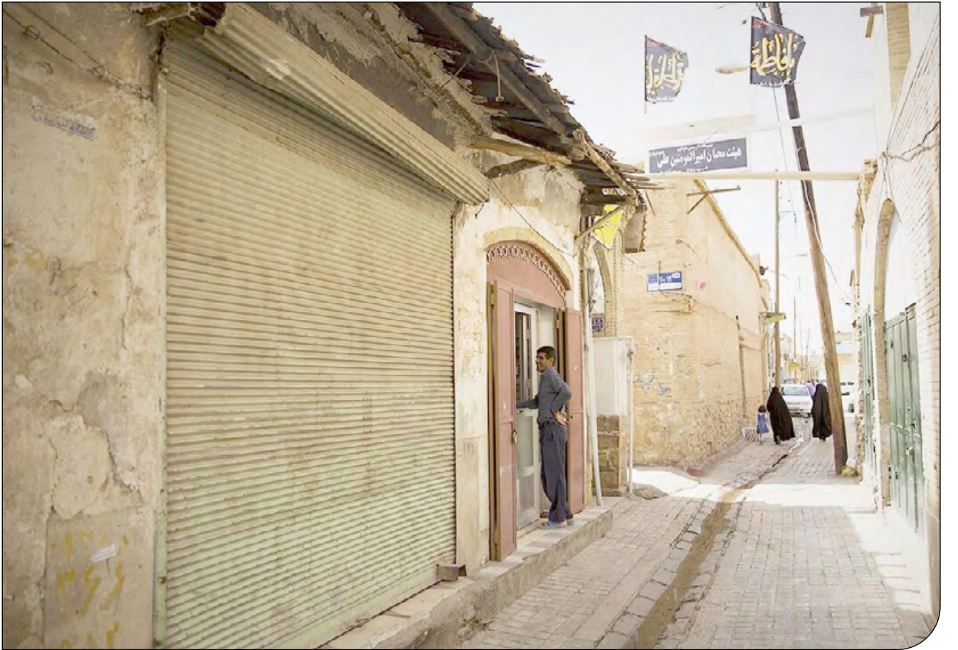
تصویری از یک کوچه در بافت تاریخی شهر مشهد.

چهار سال از ابلاغ قانون «حمایت از مرمت و احیای بافت‌های تاریخی-فرهنگی» می‌گذرد؛ قانونی که با عنوان طرح یک فوریتی حمایت از مرمت و احیای بافت‌های تاریخی-فرهنگی و توانمندسازی مالکان و بهره‌برداران بناهای تاریخی-فرهنگی به مجلس شورای اسلامی تقدیم شده بود و با تصویب در تاریخ دوم تیر ۱۳۹۸ و تأیید شورای نگهبان، هجدهم تیر همان سال به رئیس‌جمهوری ابلاغ شد. مرکز پژوهش‌های مجلس شورای اسلامی، اکنون بعد از چهار سال سرآغاز ارزیابی اجرای این قانون رفته است.