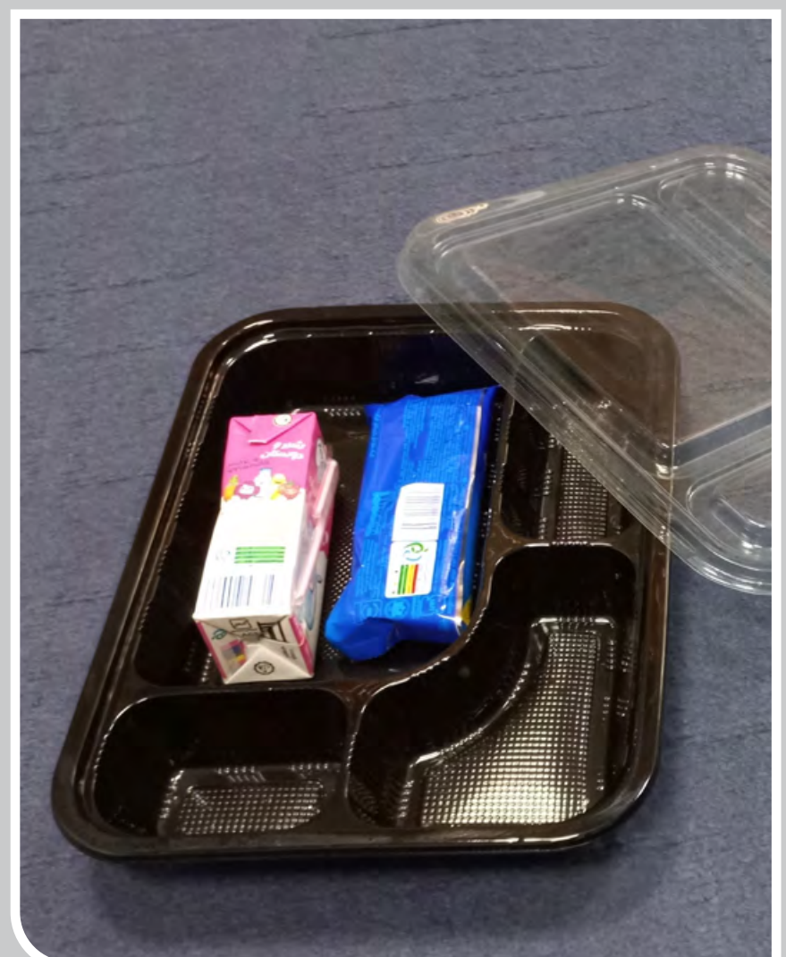
یکی از صبحانه‌های هفتگی هزاران نفر از پرسنل شیفت مجموعه صنعتی گل‌گهر. ارزش ظرف از محتویات بیشتر است.

روزنامه «پیام ما» پایداری محیط زیست را از اولویت‌های خود قرار داده است. تحریریه روزنامه برای وسعت بخشیدن به سوژه‌های مغفول مانده از آثار آلودگی پلاستیک بر محیط زیست شهروندان، جوامع محلی، منابع طبیعی، شهرها و... مسابقه عکس «هجوم پلاستیک» را به مناسبت روز جهانی محیط زیست برگزار کرد. در مدت ۱۰ روز تعیین‌شده برای فراخوان، ۸۷ عکس از عکاسان غیرحرفه‌ای و شهروندان خیرنگاران از استان‌های مختلف کشور به دست ما رسید. از آلودگی سواحل دریای خزر، مخدوش شدن محیط‌زیست اعضای جامعه محلی توسط گردشگران تا استفاده بی‌رویه از ظروف پلاستیکی توسط شرکت‌ها و کارخانه‌ها، یا حجم گسترده زباله پلاستیکی در مناطق تاریخی، سوژه‌های متفاوتی به دست روزنامه رسید همگی نشان از نیاز به توجه به گستردگی آلودگی پلاستیک در ساخت‌های مختلف زندگی انسان‌ها و حیوانات داشتند. تحریریه «پیام ما» بعد از بررسی تمامی عکس‌های دریافت شده، ۵ عکس منتخب را انتخاب و به مناسبت روز جهانی محیط زیست منتشر می‌کند. یکی از عکس‌های برگزیده مسابقه، عکس یک شماره امروز است.