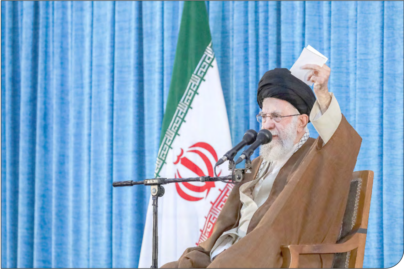
— KCO —

رهبر انقلاب در مراسم سالگرد ارتحال امام خمینی(ره) تاکید کردند