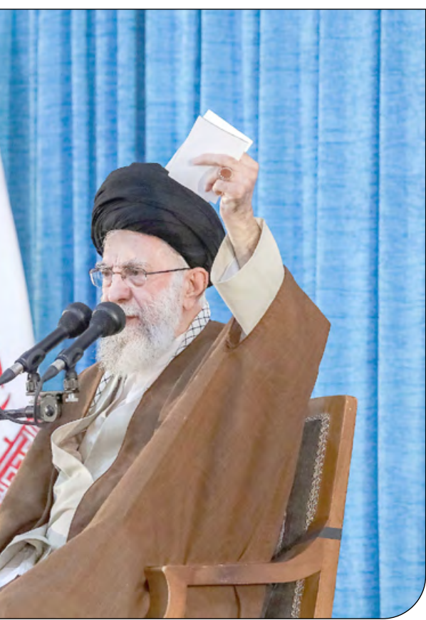
— Khamenei.ir —