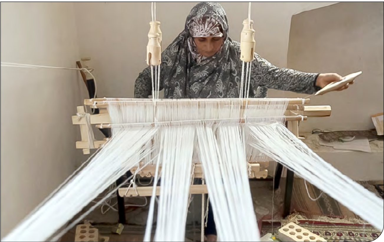
— 34 —

صنعت بافندگی در شوشتر سرآمد هنر بافندگی در ایران ، اما برخی رشته‌های بافندگی در این شهر در حال فراموشی است