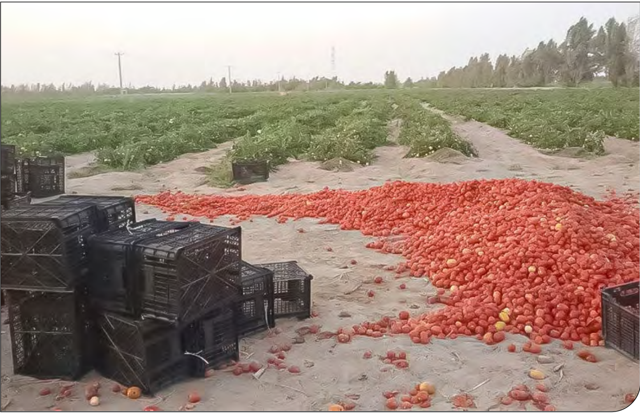
- روزنامه‌نگار -

آماری از میزان ظرفیت فعال صنایع تبدیلی به نسبت میزان کشت در استان‌های کشاورزی وجود ندارد