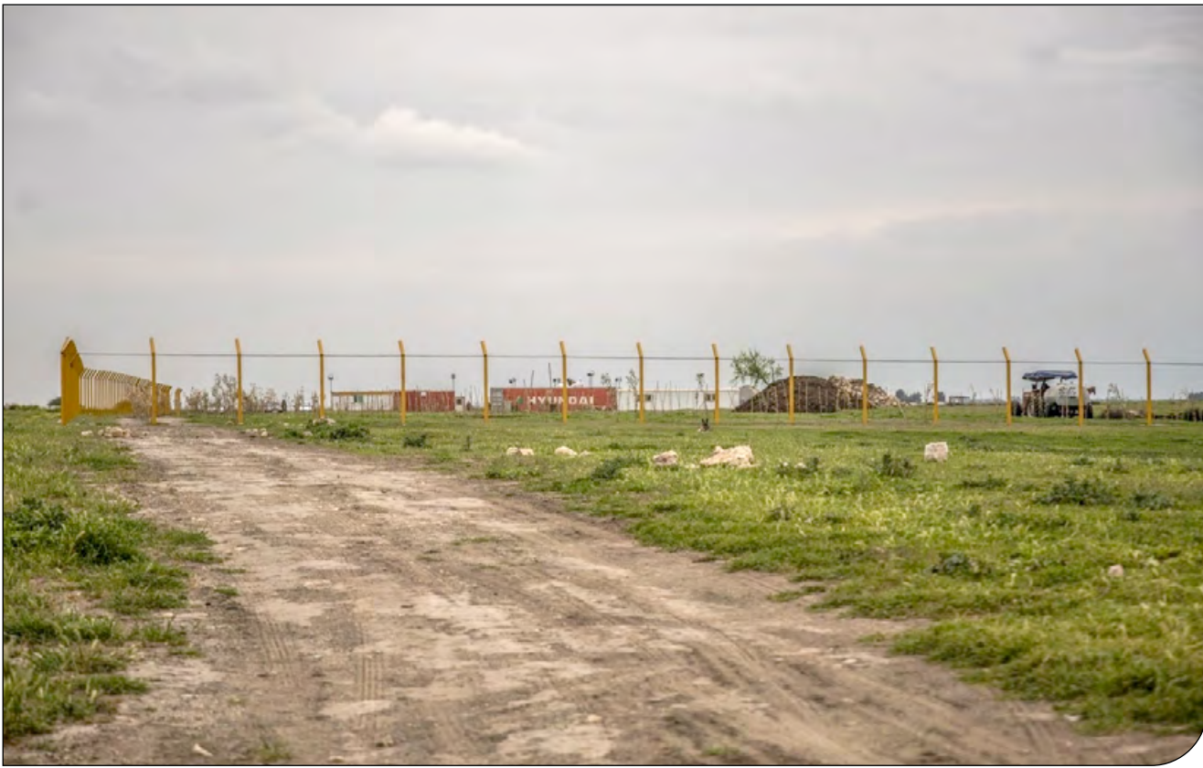
تولید پتروشیمی در میانکاله

شرکت‌های پتروشیمی دنا، مرجان و سلبلان در استان‌های دیگر در عرصه‌هایی با مساحت ۷ هکتار و با ظرفیت تولید یک میلیون ۶۵۰ هزار تن پروپیلن فعالیت می‌کنند درحالی‌که در طرح پتروشیمی امیرآباد، عرصه‌ای به مساحت ۹۰ هکتار و تنها برای تولید ۴۷۰ هزار تن در نظر گرفته شده است