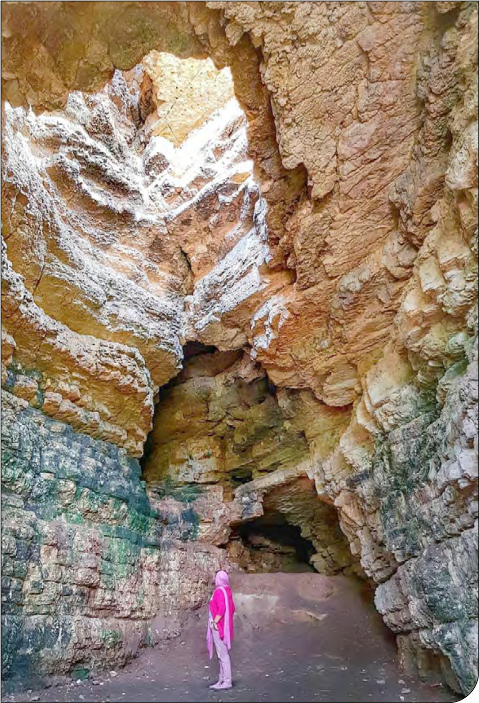
— 1 —

«محسن زنگنه» اعلام کرده است که با رئیس سازمان برنامه و بودجه تماس تلفنی گرفته و پیگیری این موضوع شده است و باید مبلغ اختصاص یافته به شهرستان تخصیص یابد.