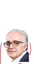
— 10 —

فاضلی ادامه می‌دهد: «هیچ‌جای ایران به اندازهٔ این منطقه آثار دورهٔ غارنشینی را ندارد و از آن را می‌توان شاهکار آثار ایران در گذر از غارنشینی به روستانشینی دانست که می‌تواند سؤالات بسیاری را پاسخ دهد.»