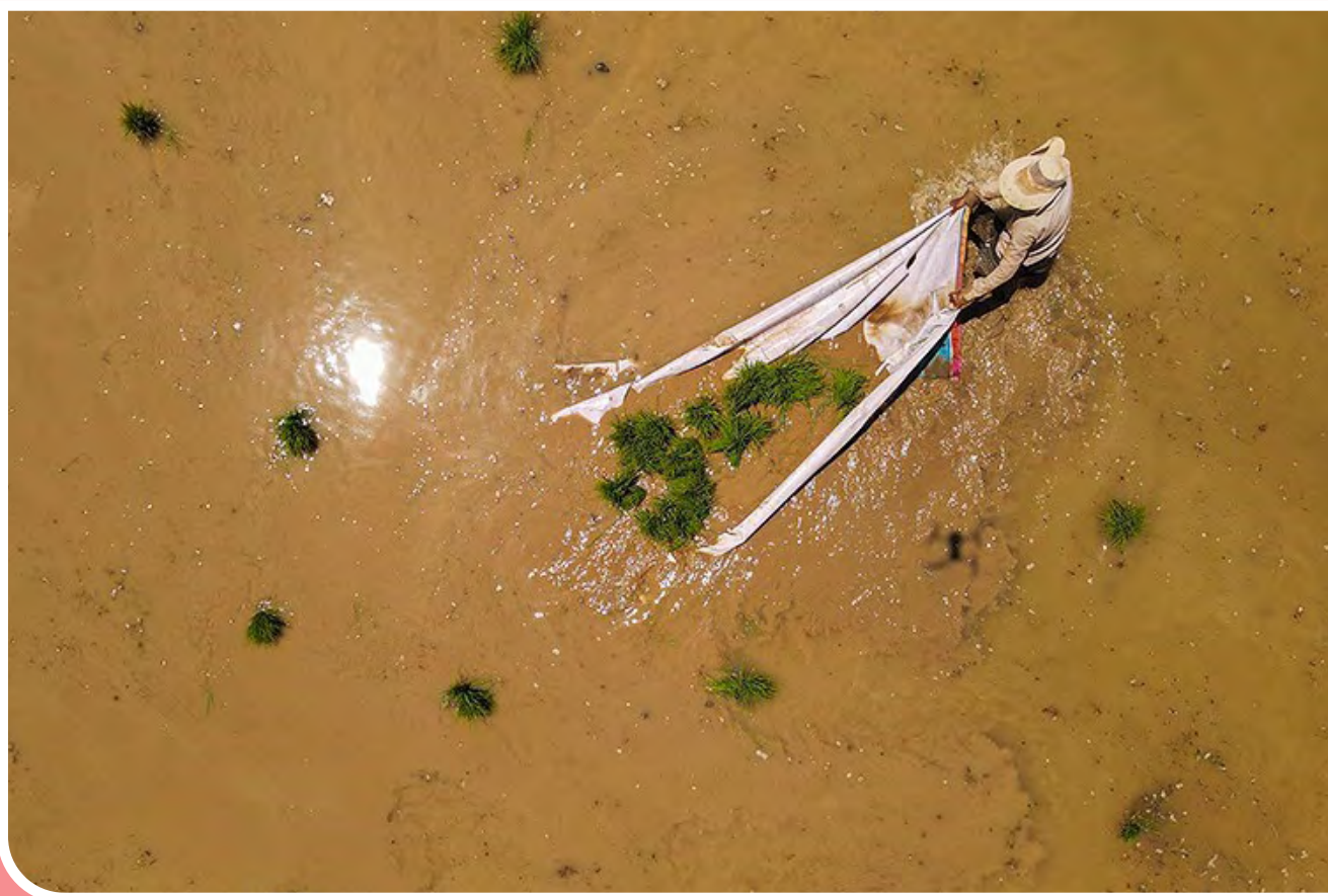
منطقه «کاکارضا» شهرستان سلسله و بیرانشهر یکی از مراکز عمده تولید برنج در استان لرستان است. در سال‌های گذشته، به دلیل کمبود آب، همواره بر سر ممنوعیت کشت برنج خارج از سه استان شمالی بحث‌های فراوانی بوده است.