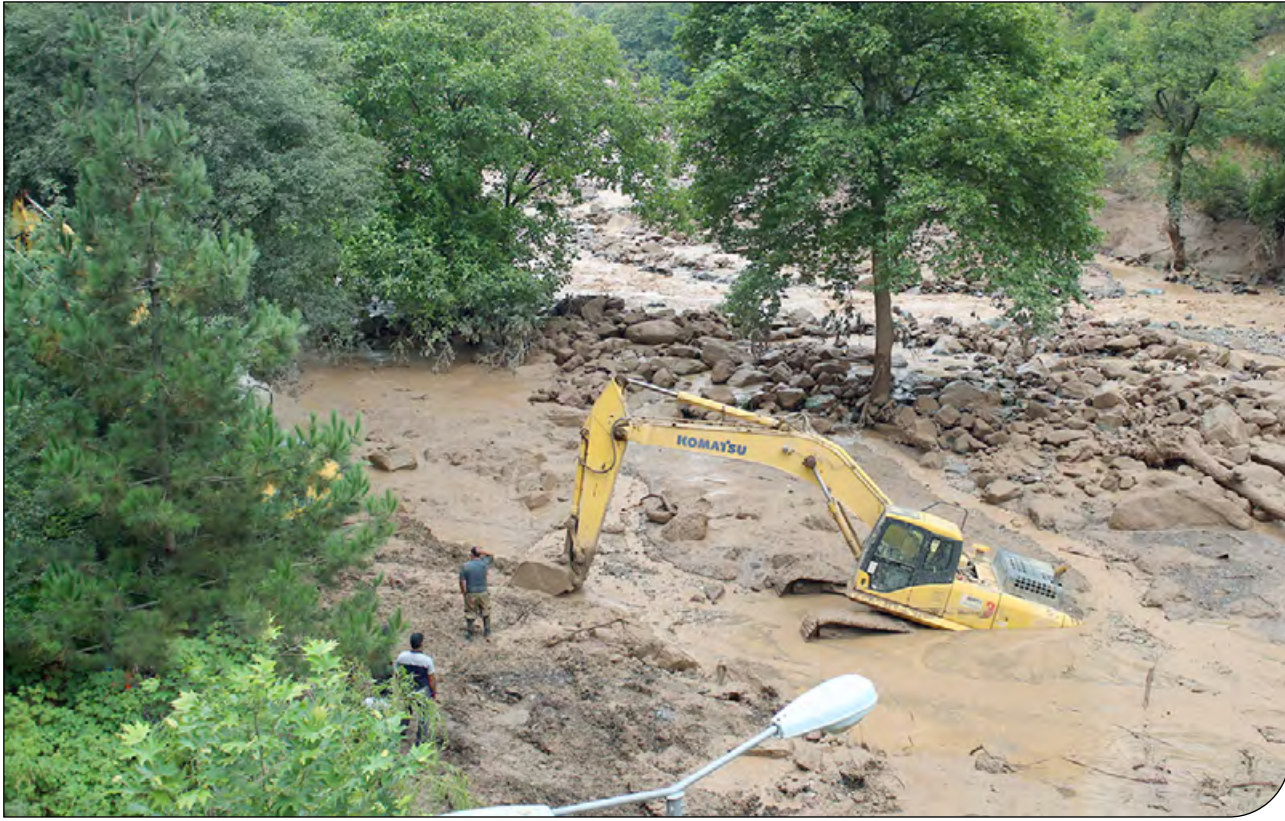
رئیس سازمان هواشناسی درباره سیلاب‌های بهاری توضیح داد