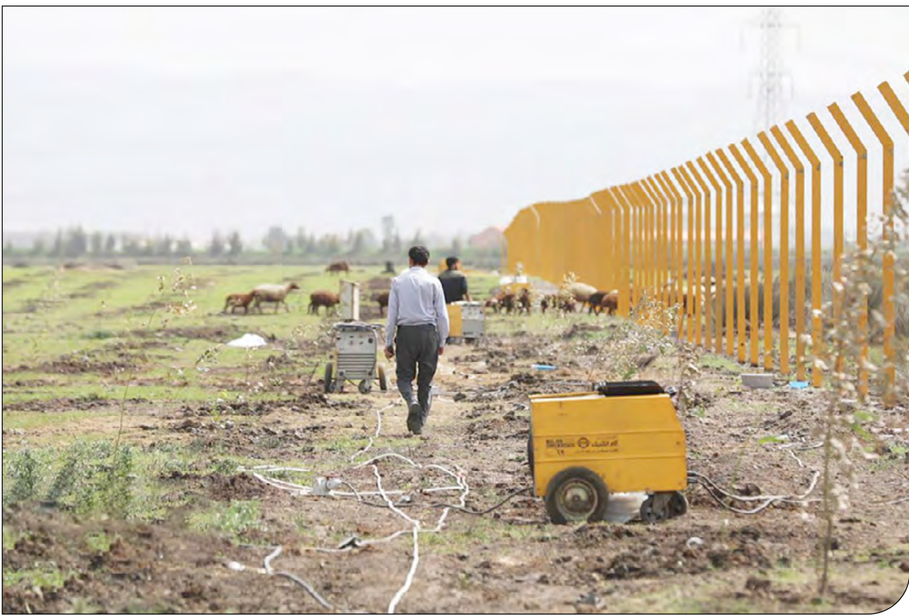
خیز جدید سرمایه‌گذار

مدیرکل دفتر ارزیابی محیط زیست: فسخ‌کنی بدون مجوز است و هر چند زمین تحت مالکیت شرکت قرار دارد اما این مالکیت به مفهوم اجازه انجام این کار نیست و ما مخالف راه‌اندازی پتروشیمی هستیم