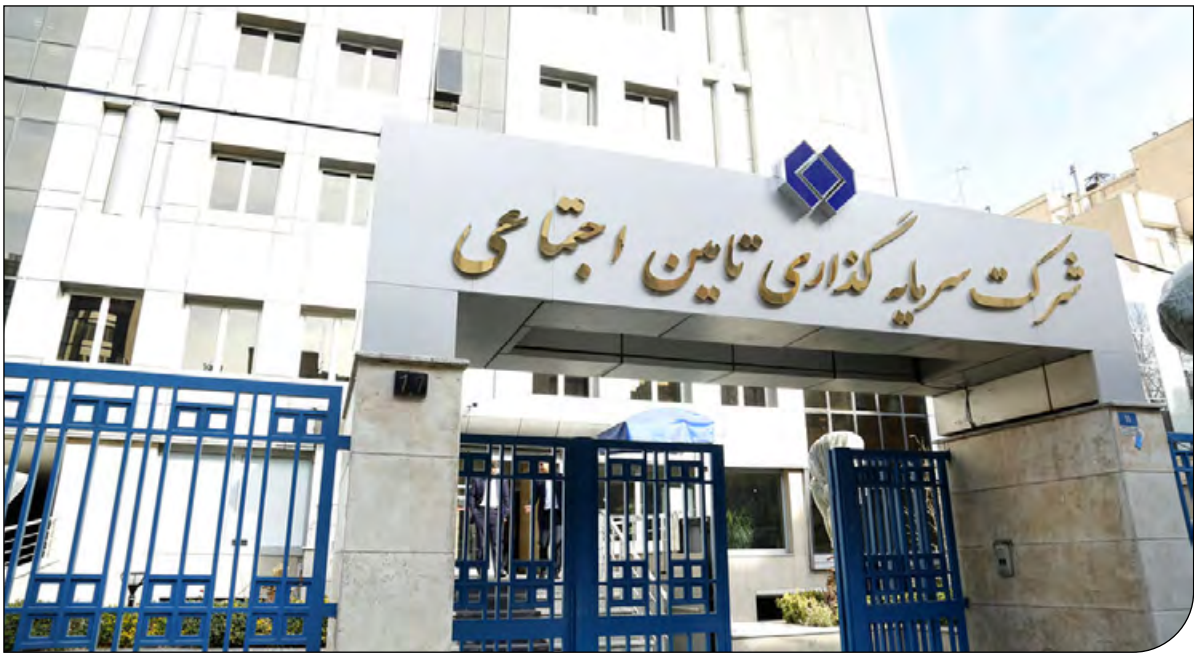
ایرنا | تهران

او افزود: اصلاح سیل‌بندها، انجام آبخیزداری و لایروبی ازجمله اقداماتی است که هر ساله برای آن در قانون، منابع بودجه اختصاص داده می‌شود اما مدیران ما قدرت پیش‌بینی مشکلات و کم کردن خسارات را ندارند به همین دلیل ما هر ساله شاهد این حوادث ناگوار و به خطر افتادن جان و مال مردم هستیم.