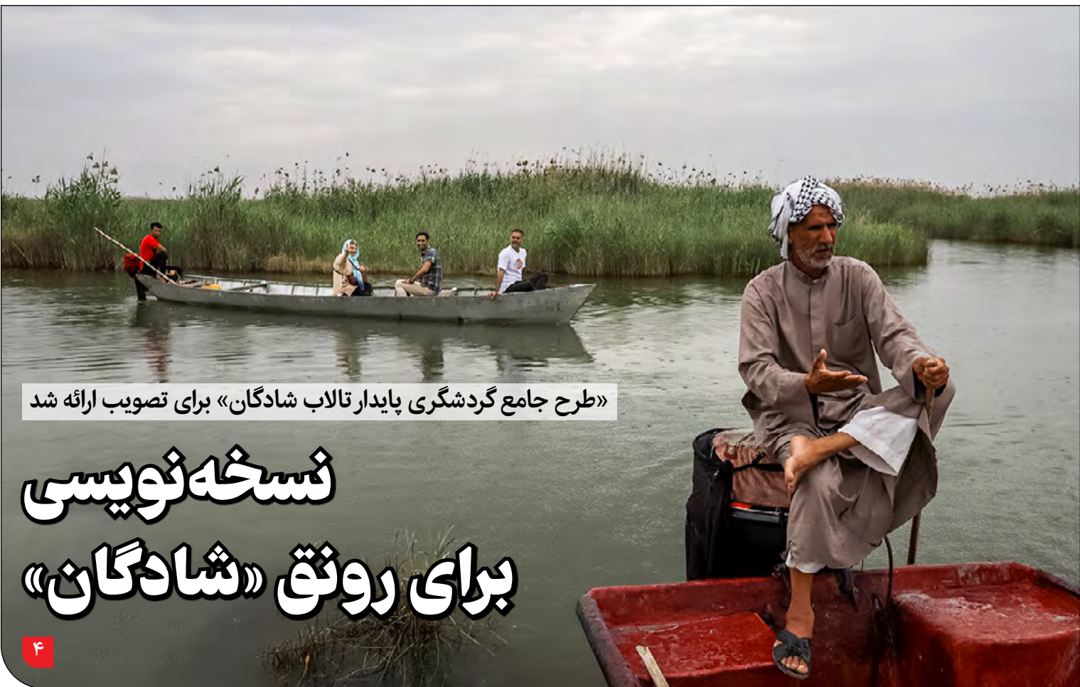
«طرح جامع گردشگری پایدار تالاب شادگان» برای تصویب ارائه شد

حسن کاظمی قمی: به جز اجرای معاهده که باید ۱۰۰ درصد عملی شود، باید برای تامین آب کشور فکر اساسی کنیم