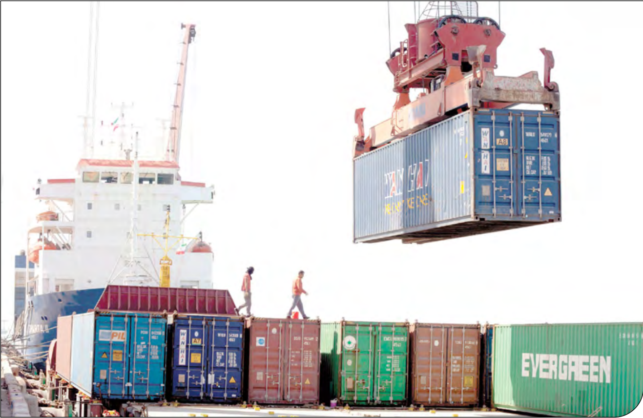
شرق تهران -

بنابر اعلام سازمان گمرک کشور، ۶ میلیون تن کالای رسوبی، به ارزشی حدودی ۱۰ میلیارد دلار در مبادی ورودی کشور وجود دارد