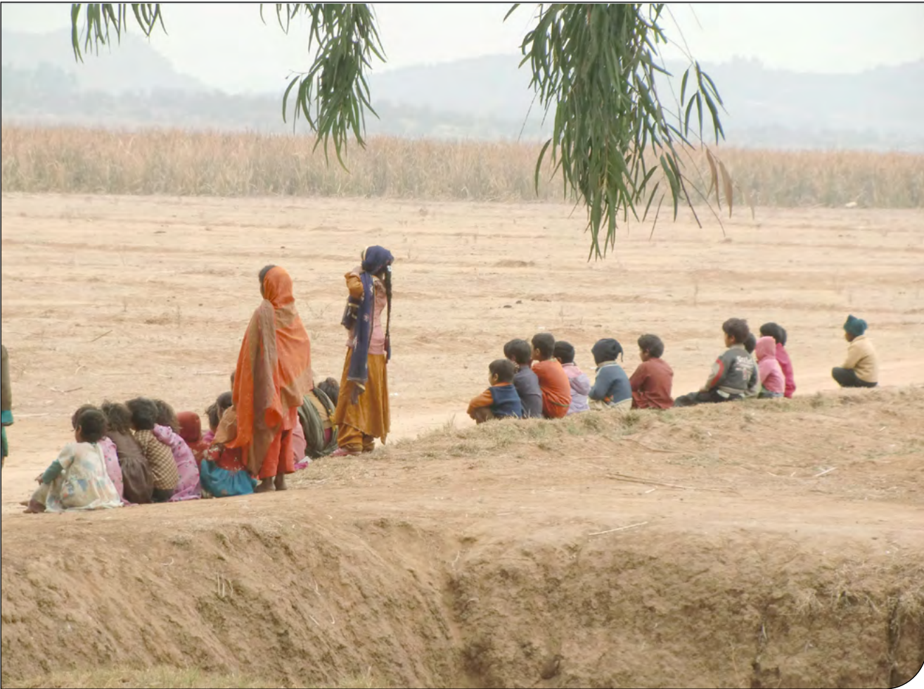
سازمان ملل متحد

تغییر اقلیم تأثیرات عمیق و نابرابر بر زنان و دختران، به‌ویژه آنان که آسیب‌پذیر هستند و به منابع طبیعی وابسته‌اند، می‌گذارد