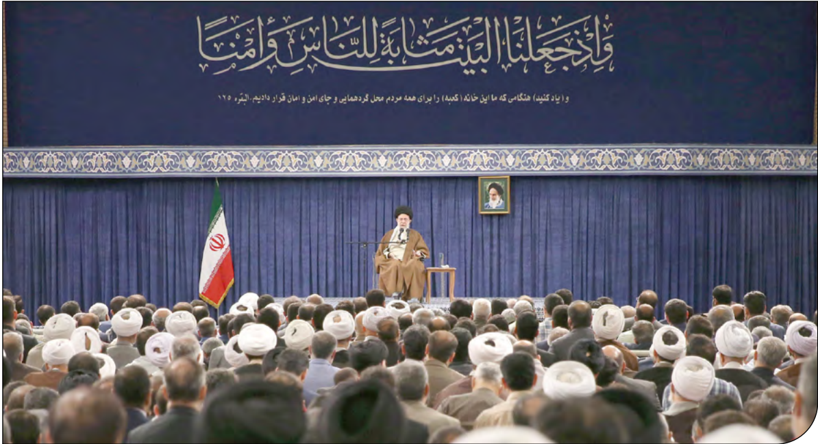
«وای کتله» هنگامی که ما این خانه (کعبه) را برای همه مردم محل گردوهایی و جای امن و امن قرار دادیم. جبره ۶۶