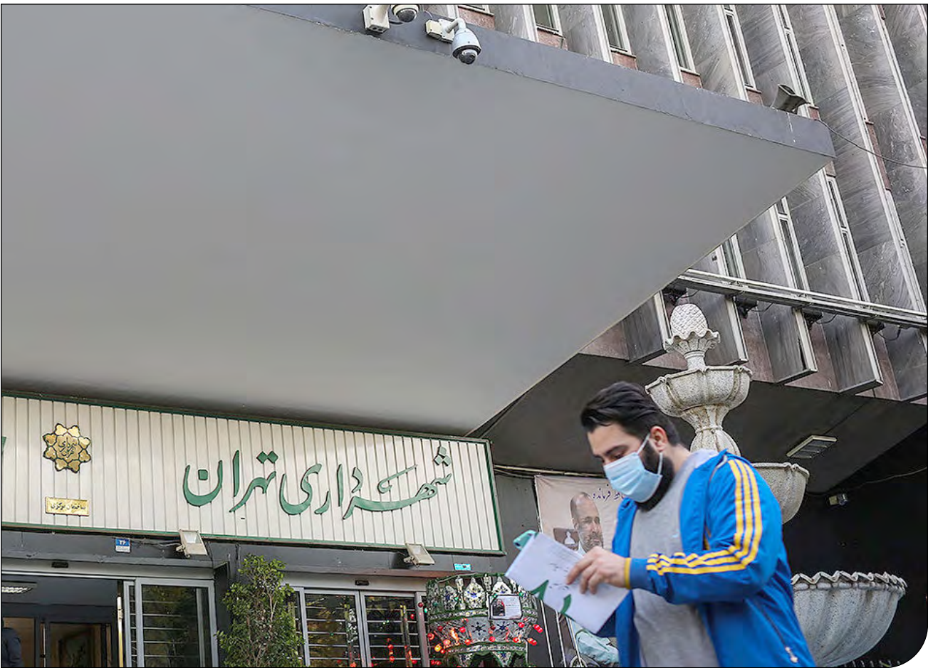
رئیس کمیته ایمنی شورای شهر تهران