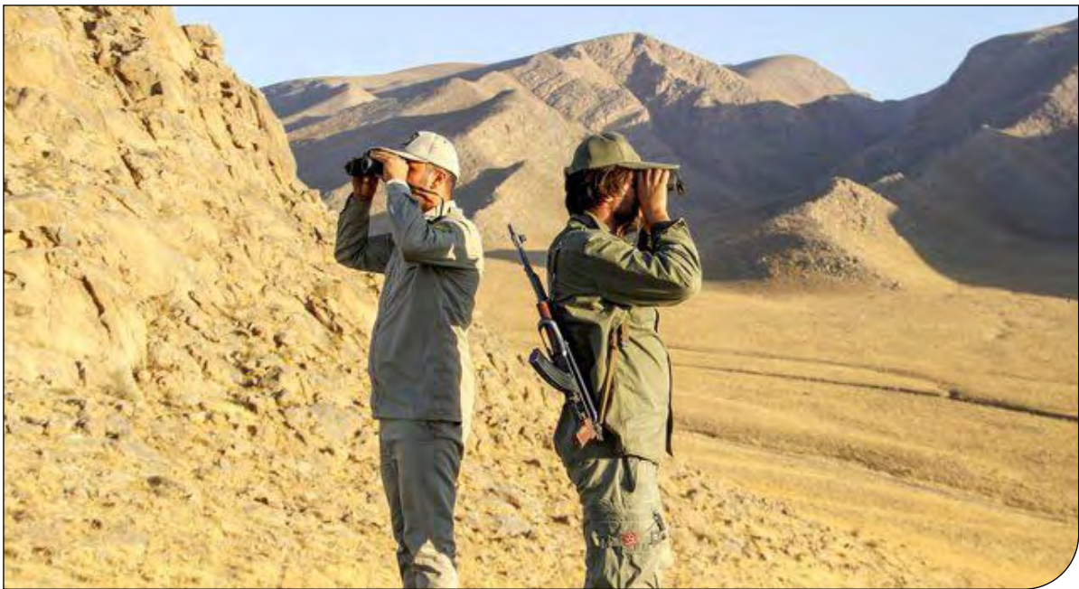
— ۳ —

وزیران در این دیدار فضای مثبت و سازنده‌ای را در تباد نظر داشتند و توافق کردند که در دورهٔ آتی تماس‌ها و گفت‌وگوهای فنی در سطح بالا در این قالب چهارجانبه ادامه یابد.»