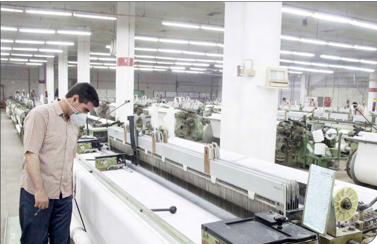
کارگر در کارخانه فولاد

در دو سال گذشته ناترازی برق حدود ۷ میلیارد دلار به صنایع فولاد، سیمان و صنایع فلزی خسارت زد