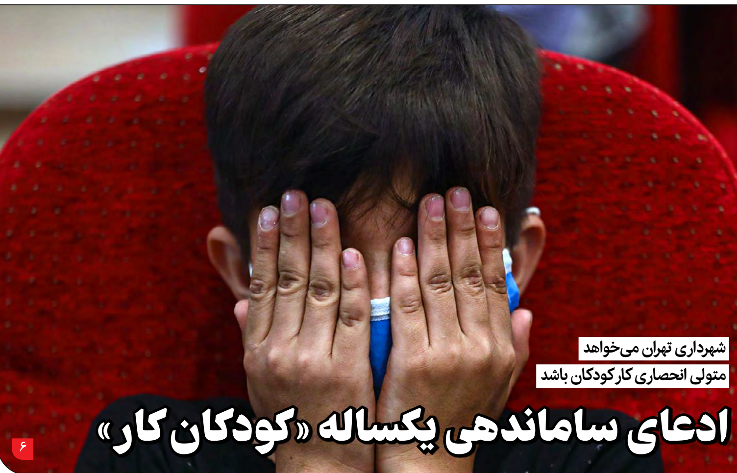
شهرداری تهران می‌خواهد متولی انحصاری کار کودکان باشد