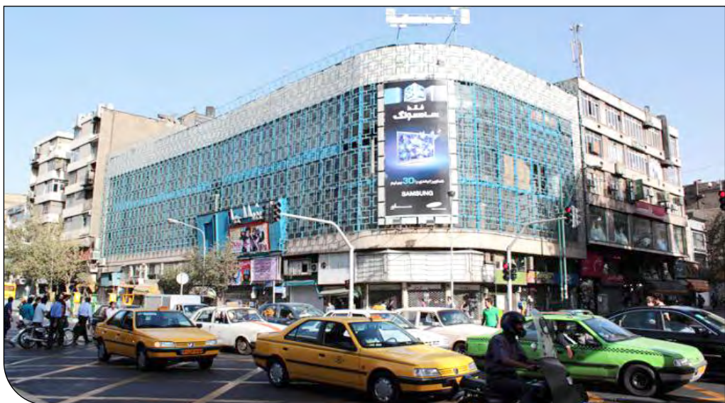
تصویری از سالن‌های سینما در برخی مناطق ایران.

واقع در استان‌های چهارمحال و بختیاری (۴/۶۵ درصد) و زنجان (۴/۷۶ درصد) بیشترین اختلاف نسبتی را بین شهرهای استان و شهرهای دارای سالن به ثبت رسانده‌اند. استان‌های اصفهان و فارس که از بزرگترین و مورد توجه‌ترین استان‌های کشور دارای بیشترین تعداد شهرها هستند، از جهت تعداد سالن‌ها و سالن‌های نمایش مشکلات فراوانی دارند که خود نشان از توسعهٔ ناهمگن در این استان‌ها دارد. این گزارش اضافه می‌کند: «در استان اصفهان از تعداد ۱۱۰ شهر، ۲۱ شهر دارای سالن است (۱۹/۰۹ درصد) و در استان فارس