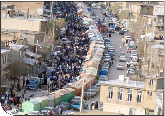
بازارچه مرزی در استان کردستان