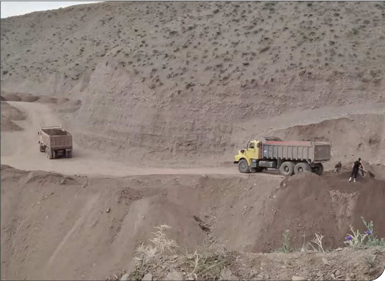
توقف بهره‌برداری از معدن هرنج

«سی هکتار زمین مسطح. مسئله بر سر تصاحب زمین است نه معدن‌کاوی.» جمله‌اش لابلای صدای بادهای دشت «هرنج» گم می‌شود. در میان کوه‌های طالقان. از ده سال قبل که پروانه بهره‌برداری معدن «مخلوط کوهی هرنج» صادر شد، تا چند سال بعد که کار برداشت شن و ماسه در آن شروع شود، هرنجی‌ها دست از شکایت نکشیدند. معدن به زمین‌های شخصی تجاوز کرده بود و زمین‌هایی که زمانی مأمن جو و گندم بودند، از بین رفتند و برای همین هم محلی‌ها می‌گویند: «معدن بهانه است و می‌خواهند زمین‌های مسطح منطقه را مال خود کنند.» شکایت‌ها اما بالاخره جواب گرفت و چند روز قبل مرجع قضایی این حوزه با صدور رأی حکم به تعطیلی برداشت از زمین‌های این روستا داد.