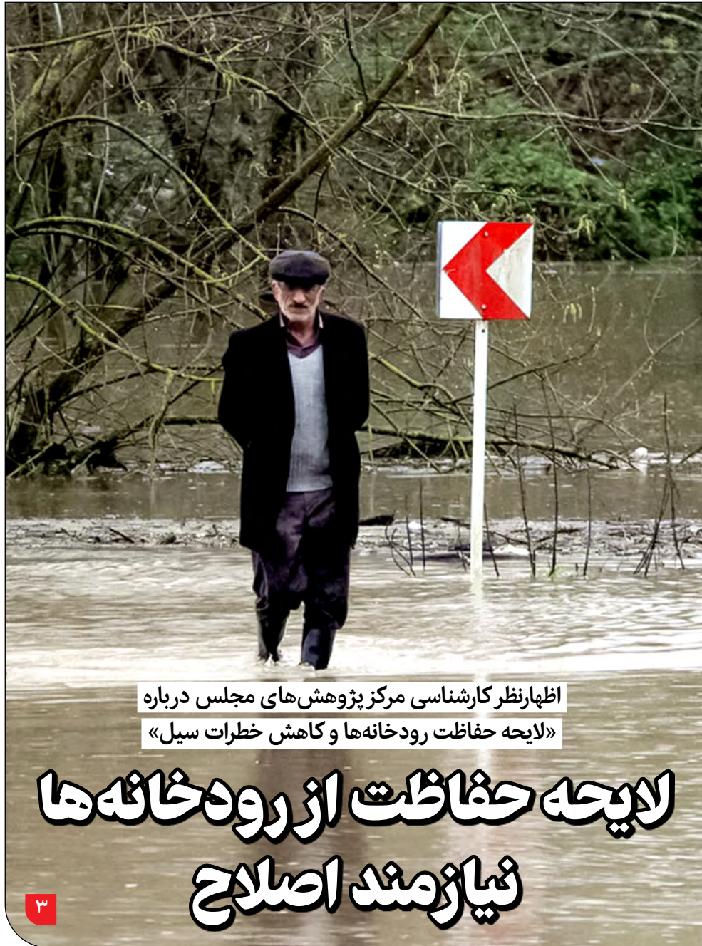
اظهار نظر کارشناسی مرکز پژوهش های مجلس درباره «لایحه حفاظت رودخانه ها و کاهش خطرات سیل»