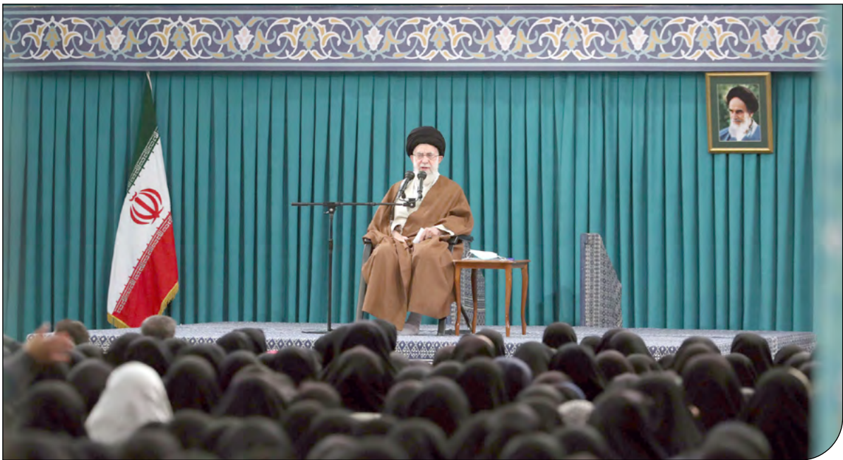
— leader.ir —

حسین‌زهی تصریح کرد: از وزارت خارجه نیز درخواست داریم که با جدیت با طالبان مذاکره انجام دهند تا حق آبه ایران از هیرمند گرفته شود. خوشبختانه بنده شنیدم که گفته شده امسال حق آبه رودخانه هیرمند داده خواهد شد. امیدوارم این موضوع تحقق پیدا کرده و از یکی از نگرانی‌های مردم کاسته شود در غیر اینصورت علی‌رغم کارهای بسیار خوبی که در استان سیستان و بلوچستان انجام شده با بحران آبی مواجه خواهیم شد.