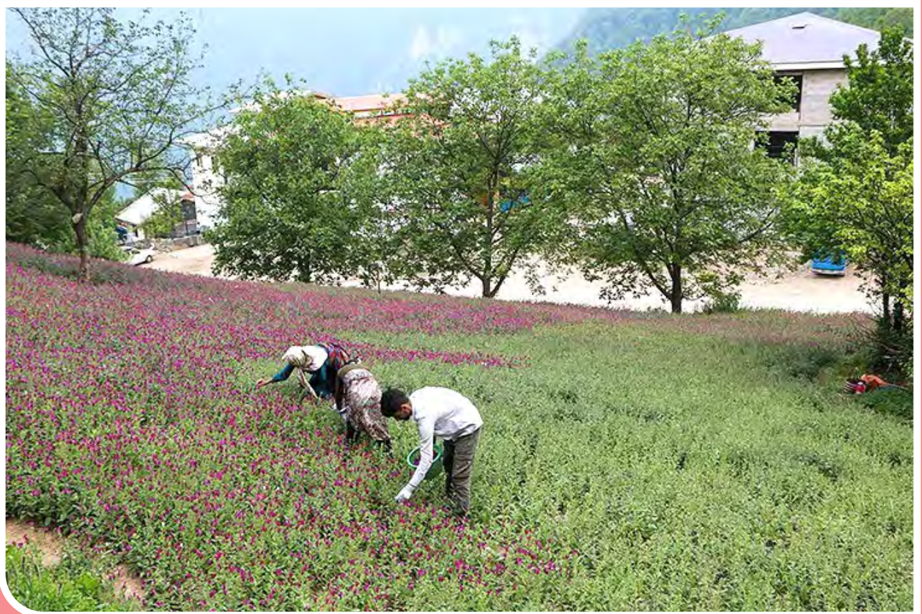
برداشت گل گاو زبان در روستای سحبران گیلان مناطق کوهستانی اشکورات رحیم‌آباد رودسر با ۴۷۰ هکتار مساحت زیرکشت و برداشت ۲۲۰ تن قطب تولید گل گاو زبان کشور است. اشکورات رحیم‌آباد رودسر با تولید ۷۵ درصد گل گاو زبان از مناطق مهم تولید این گیاه دارویی در ایران و به‌عنوان پایتخت گل گاو زبان ایران شناخته شده است.