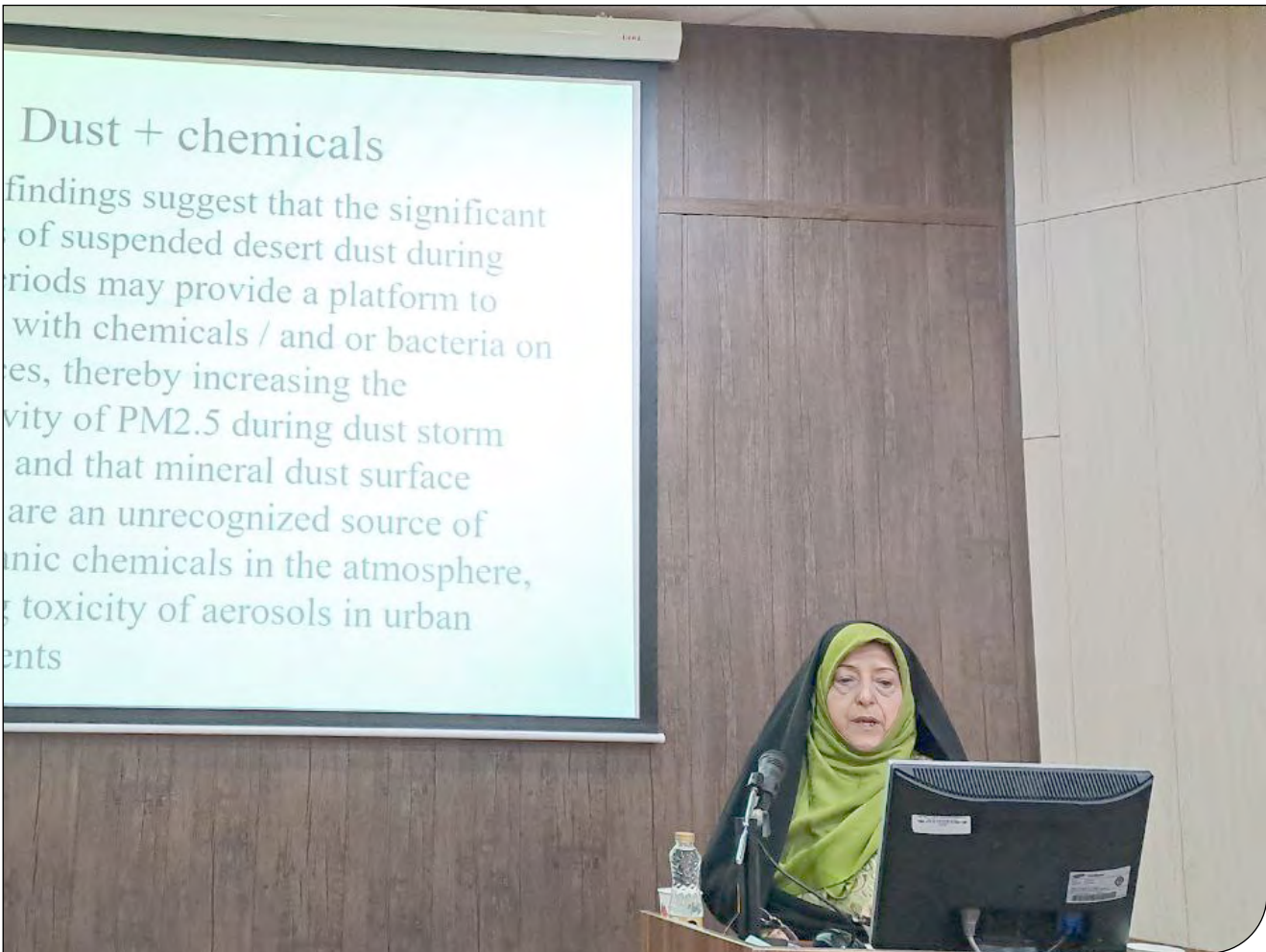
- دیدنی -