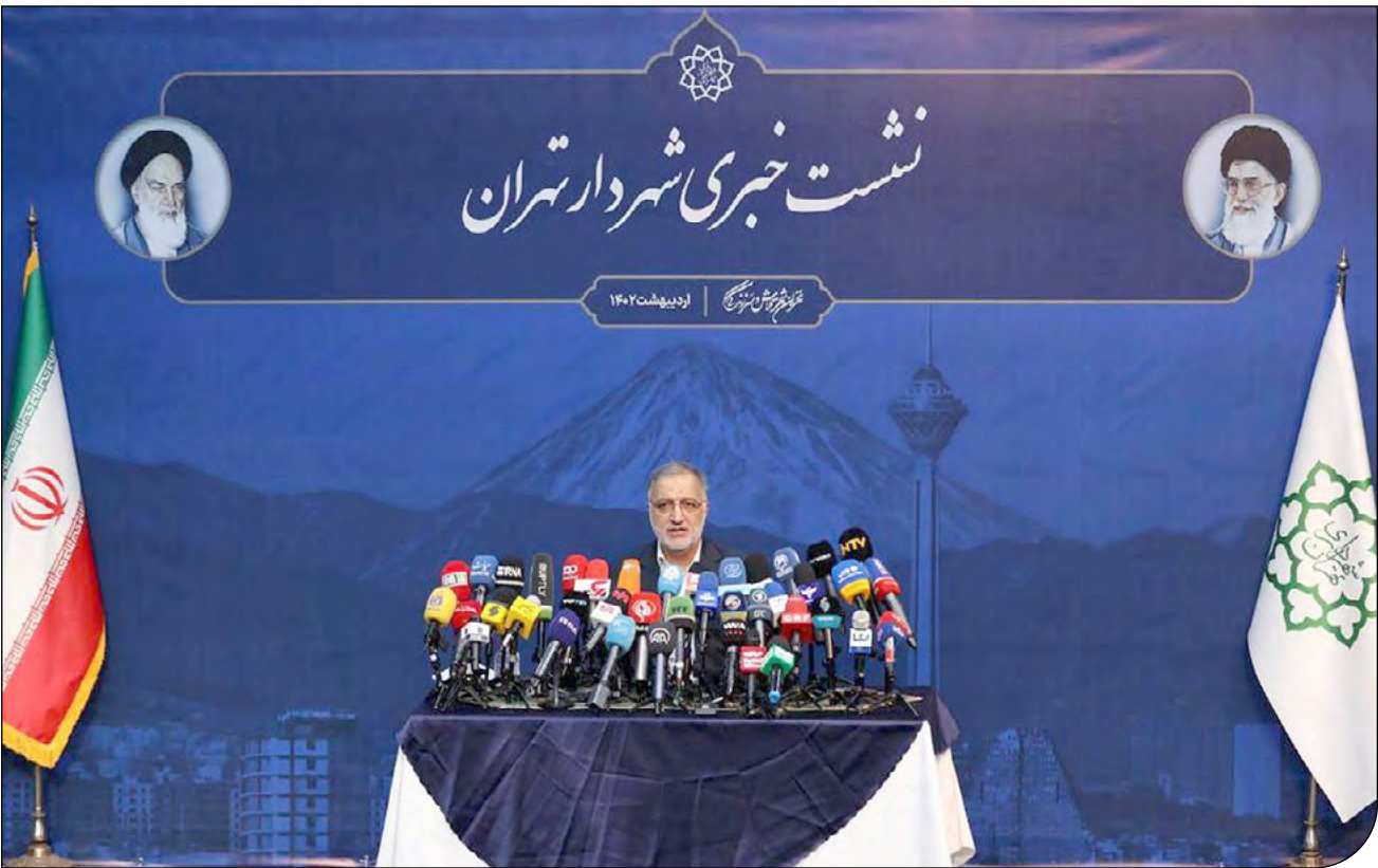
شهردار تهران: «پژوهشگران دقت کنند»