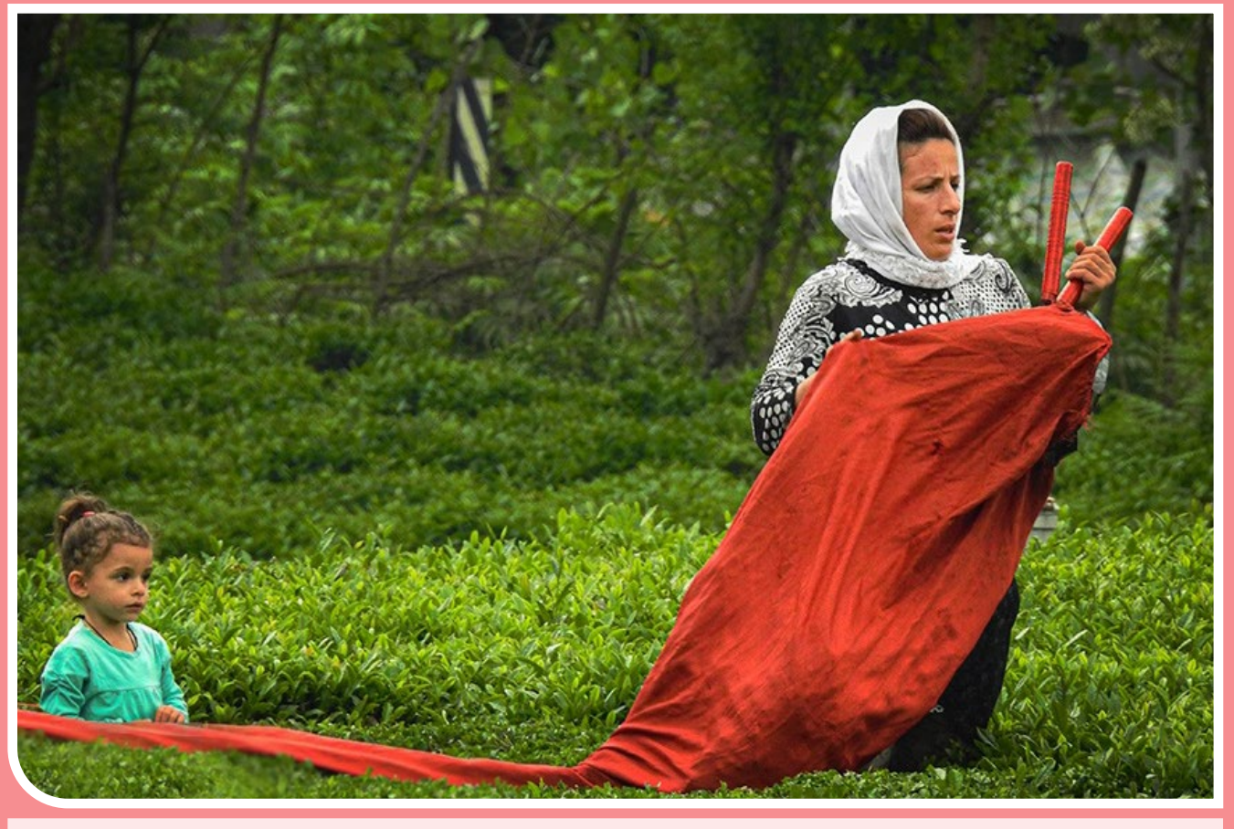
برداشت «برگ سبز چای» در گیلان - خاطره احمدی‌نژاد همزمان با سپری شدن نیمه اردیبهشت، برداشت برگ سبز چای در باغات گیلان آغاز شده است. پیش‌بینی می‌شود امسال بیش از ۱۳۰ هزار تن برگ سبز چای از باغات چای گیلان و مازندران برداشت شود.