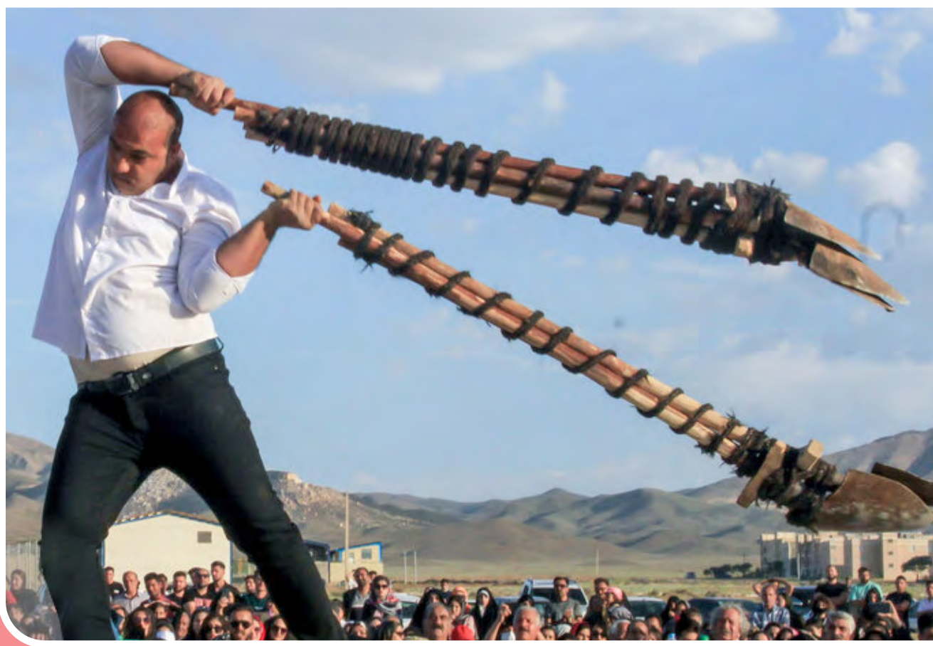
آیین سنتی بیل‌گردانی قدمتی دوهزارساله دارد که به‌منظور پاسداشت آب، شکرگزاری کشاورزان و دعا برای سالی پربرابر در شهر «نیمور» محلات برگزار می‌شود.