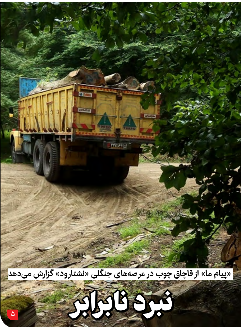
«پیام ما» از قاچاق چوب در عرصه‌های جنگلی «نشتارود» گزارش می‌دهد