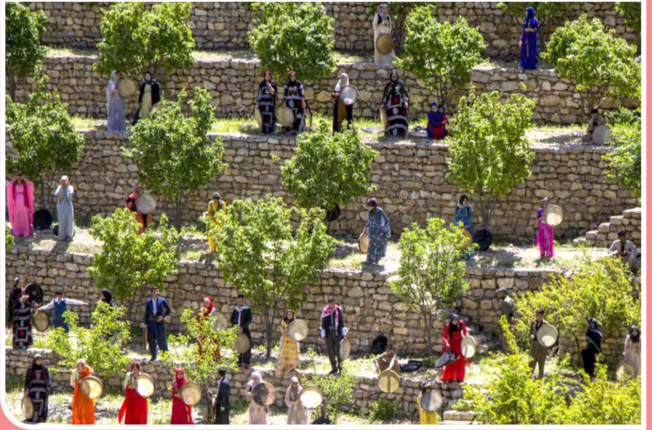
نوی هزار دف برفراز «باینگان» «باینگان» یکی از شهرهای استان کرمانشاه در غرب ایران است. این شهر در بخش باینگان شهرستان پاوه قرار دارد. نغمه‌های محلی و موسیقی عرفانی خانقاه در مناطق کردنشین همیشه مورد توجه گردشگران بوده است.