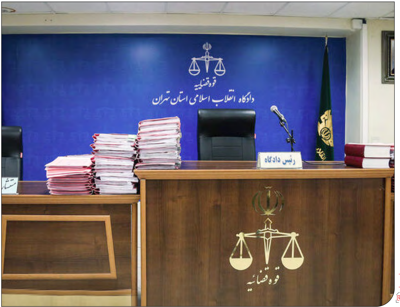
«پیام ما» حق قضاوت زنان در دستگاه قضایی را بررسی کرد