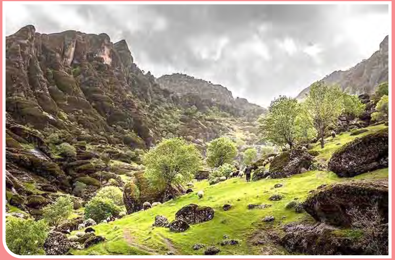
طبیعت بهاری منطقه کوهستانی هفت‌حوض - عکس از عزیز بابانژاد مراتع سرسبز، آبشارهای جاری، جنگل‌های فندق و غیره از جمله دیدنی‌های طبیعی استان لرستان است. هفت‌حوض در نزدیکی روستای پیرجد از توابع شهرستان خرم‌آباد، منطقه‌ای زیبا و شامل صخره‌های مخملی و صیقلی است.