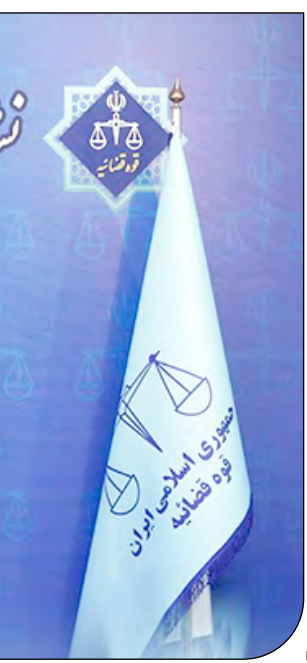
— فرش — [۱]

بنابر اعلام وزارت بهداشت، در شبانه‌روز منتهی به چهارشنبه ۳۴۱ مبتلای جدید به کرونا شناسایی شده و ۱۷ بیمار نیز جان خود را از دست داده‌اند. به گزارش ایسنا، روز سه‌شنبه تا دیروز ۶ اردیبهشت‌ماه ۱۴۰۲ و بر اساس معیارهای قطعی تشخیصی، ۳۴۱ بیمار جدید مبتلا به کووید۲۰۱۹ در کشور شناسایی شده که ۱۸۵ نفر از آنها بستری شدند. با این حساب مجموع بیماران کووید۲۰۱۹ در کشور به هفت میلیون و ۶۰۷ هزار و ۷۴۴ نفر رسید. متأسفانه در طول ۲۴ ساعت منتهی به چهارشنبه، با جان باختن ۱۷ نفر از بیماران مبتلا به کووید۱۹ در کشور، مجموع جان باختگان این بیماری، به ۱۴۶ هزار و ۵۸ نفر رسید. خوشبختانه تا کنون هفت میلیون ۳۵۷ هزار و ۴۸۹ نفر از بیماران، بهبود یافته و یا از بیمارستان‌ها ترخیص شده‌اند. مجموعاً نیز در حال حاضر ۶۵۲ نفر از بیماران مبتلا به کووید۲۰۱۹ در بخش های مراقبت‌های ویژه بیمارستان‌ها تحت مراقبت قرار دارند. تاکنون ۵۶ میلیون و ۳۳۱ هزار و ۴۹۴ آزمایش تشخیص کووید۲۰۱۹ در کشور انجام شده و ۶۵ میلیون و ۲۱۶ هزار و ۱۹۱ نفر دژ اول، ۵۸ میلیون و ۶۱۱ هزار و ۸۰۳ نفر دژ دوم، تاکنون ۶۹۳ هزار و ۵۱۵ نفر، دژ سوم و بالاتر واکسن کرونا را تزریق کرده‌اند. مجموع واکسن‌های تزریق شده در کشور به ۱۵۵ میلیون و ۵۲۱ هزار و ۵۰۹ دژ رسیده است.