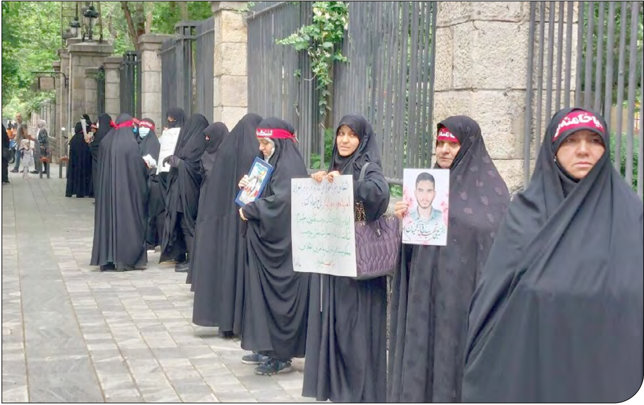
پروژه‌های محلات کم‌برخوردار

به گفته استاندار تهران، ۲۴۷ محل در استان تهران، به‌عنوان «محل کم‌برخوردار» شناسایی شدند. به گزارش ایسنا، علیرضا فخاری در اولین جلسه کارگروه اجتماعی، فرهنگی، سلامت، زنان و خانواده استان تهران با محوریت بررسی آخرین وضعیت اجرای طرح توانمندسازی محلات کم‌برخوردار گفت: «۹۰ محل در شهرستان‌های استان تهران و ۱۵۷ محل در شهر تهران کم‌برخوردار هستند.» او درباره اهمیت شناسایی این محلات توضیح داد: «شناسایی مشکلات این محلات در حوزه‌های مختلف و ارتقای محلات در زمینه‌های آموزش، پرورش، اسکان، بهداشت و درمان و توسعه زیرساخت‌ها پیگیری می‌شود.» فخاری همچنین به ایجاد تشکل‌های مردمی در این محلات اشاره کرد: «در شهرداری‌های این محله‌ها سعی می‌شود تا اداره امور توسط مردم انجام شود و در آینده‌ای نزدیک با همراهی و همکاری، افزایش مشارکت در محلات را شاهد باشیم و سطوح محلات کم‌برخوردار را ارتقا دهیم.» استاندار تهران از همکاری چهار دستگاه اصلی بهزیستی، کمیته امداد، ستاد اجرایی فرمان امام (ره) و هلال احمر در اجرای این طرح خبر داد: «اقدامات دستگاه‌ها در حوزه‌های مختلف و با رویکرد نشاط‌افزینی محلات انجام شود.» به گزارش پایگاه اطلاع‌رسانی استانداری تهران، او خاطرنشان کرد: «هدف‌گذاری برای ایجاد ۳۰۰ هزار واحد مسکونی با اولویت بافت‌های فرسوده در این محلات مدنظر قرار گرفته است که به اقتصاد و معیشت خانوادها در محله‌ها کمک می‌کند.»