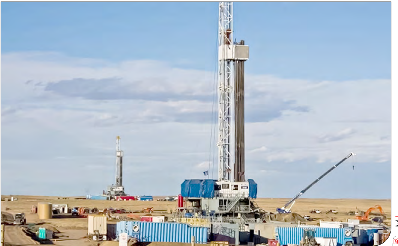
یک چاه آب در استان سیستان و بلوچستان

مقاله‌ای در نقد رویکرد تبلیغاتی دربارهٔ اثربخشی چاه‌های آب ژرف زابل (قسمت آخر)