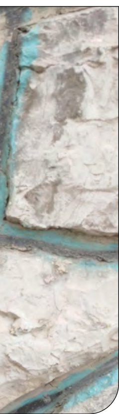
ناصر خدیوی پیام با