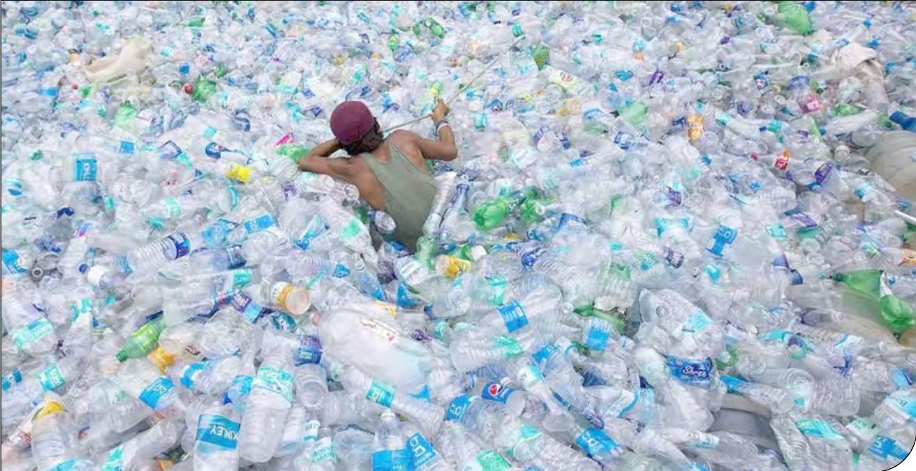
— ۸۹ —

در حال حاضر، حدود ۶۰۰ میلیارد بطری پلاستیکی در جهان تولید می‌شود که تقریبا معادل ۲۵ میلیون تن زبالهٔ پلاستیکی است که بازیافت نمی‌شوند