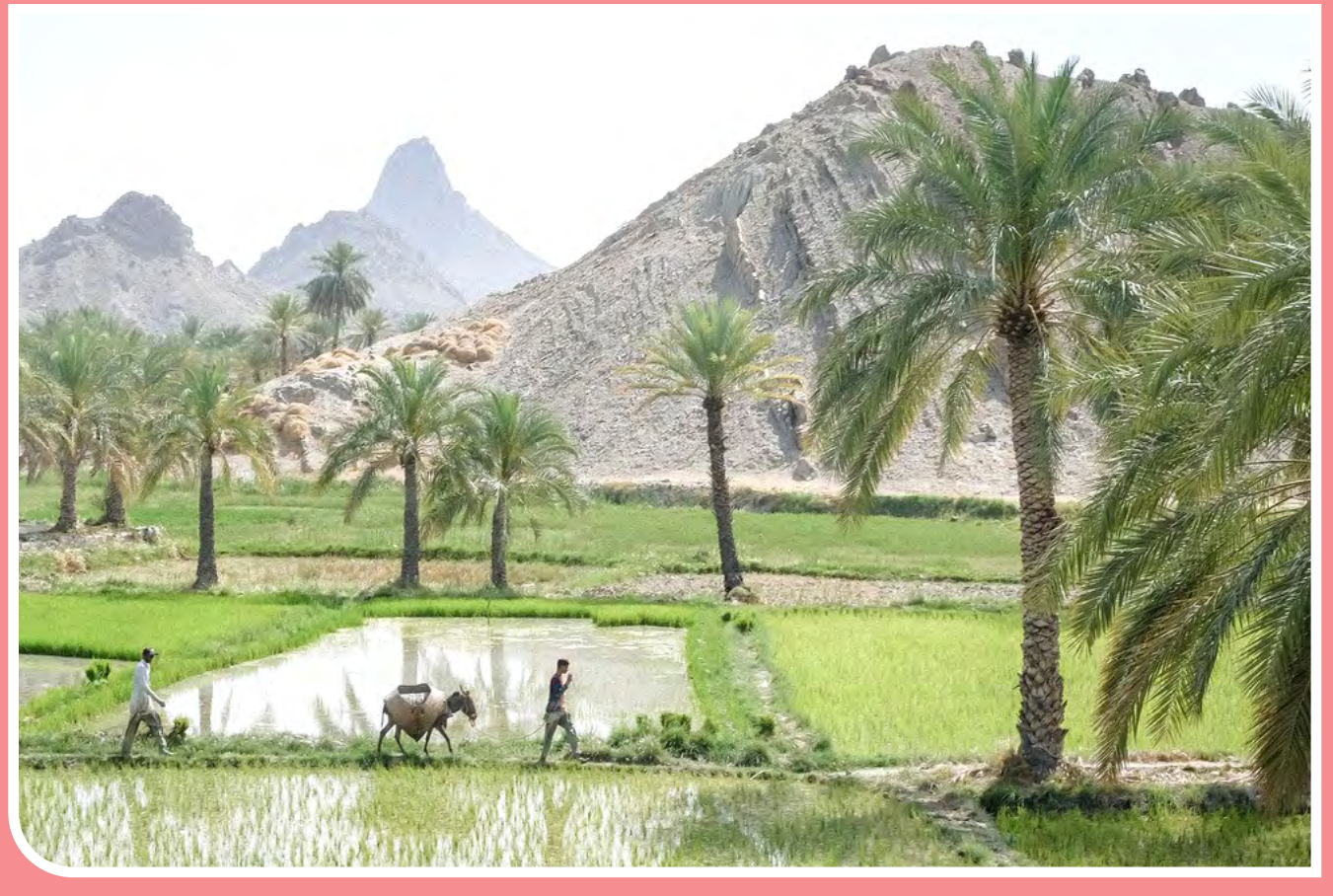
کشت بهاره برنج در قصرقند سیستان و بلوچستان شهرستان قصرقند در جنوب سیستان و بلوچستان قرار دارد در این شهرستان بیش از ۱۰ رقم برنج کاشت می‌شود منابع تأمین آب شالیزارهای قصرقند ۱۰۰ درصد از قنات است