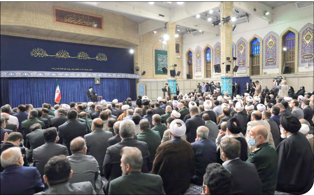
رئیس‌جمهور ایران در دیدار با رهبر انقلاب اسلامی

او از حمایت جمهوری اسلامی ایران از ملت فلسطین تقدیر کرد و اظهار داشت موضوع فلسطین تنها مسئلهٔ ملت فلسطین نیست، بلکه مسئلهٔ کل امت اسلامی است و ایران در این موضوع پیشگام بوده است.