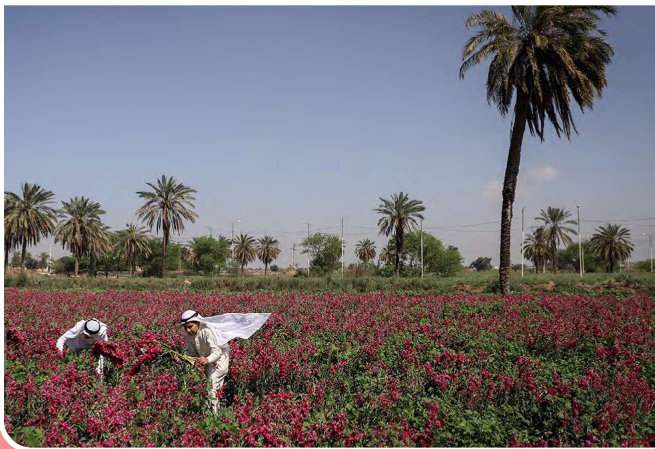
برداشت گل در حمیدیه - حمیدیه از شهرستان‌های استان خوزستان در جنوب غربی ایران است. ۵۰ سال است که در منطقه شبیشه شهرستان حمیدیه انواع گل از جمله سنبل، آفتابگردان، گل خشک، زنبق و نرگس کشت می‌شود.