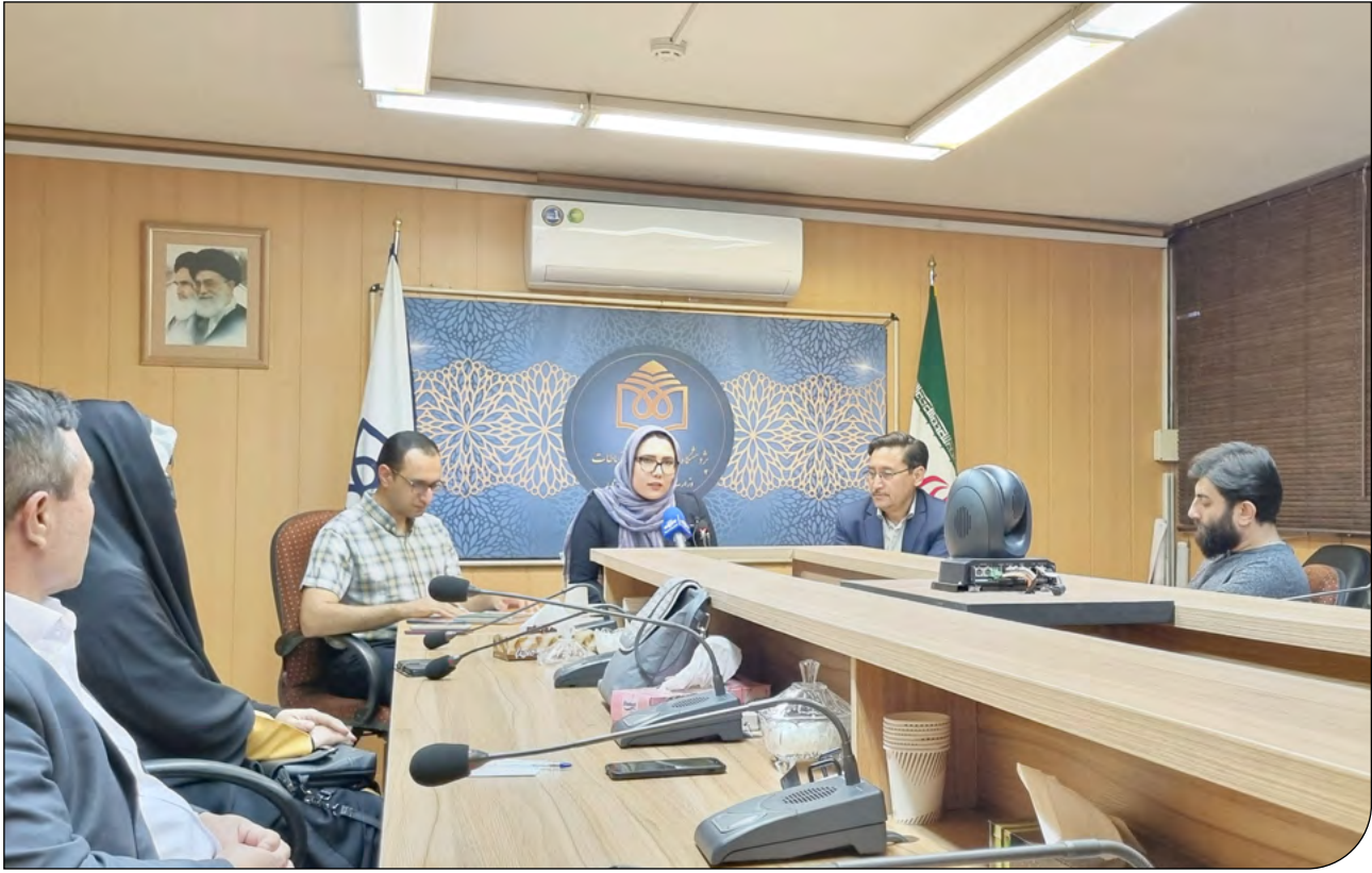
انجمن مدارس | انجمن مدارس