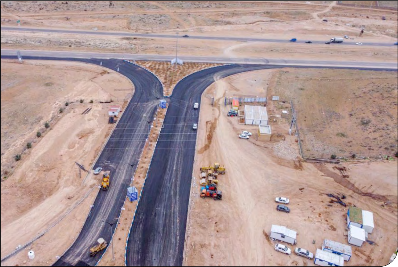
— فروردین —