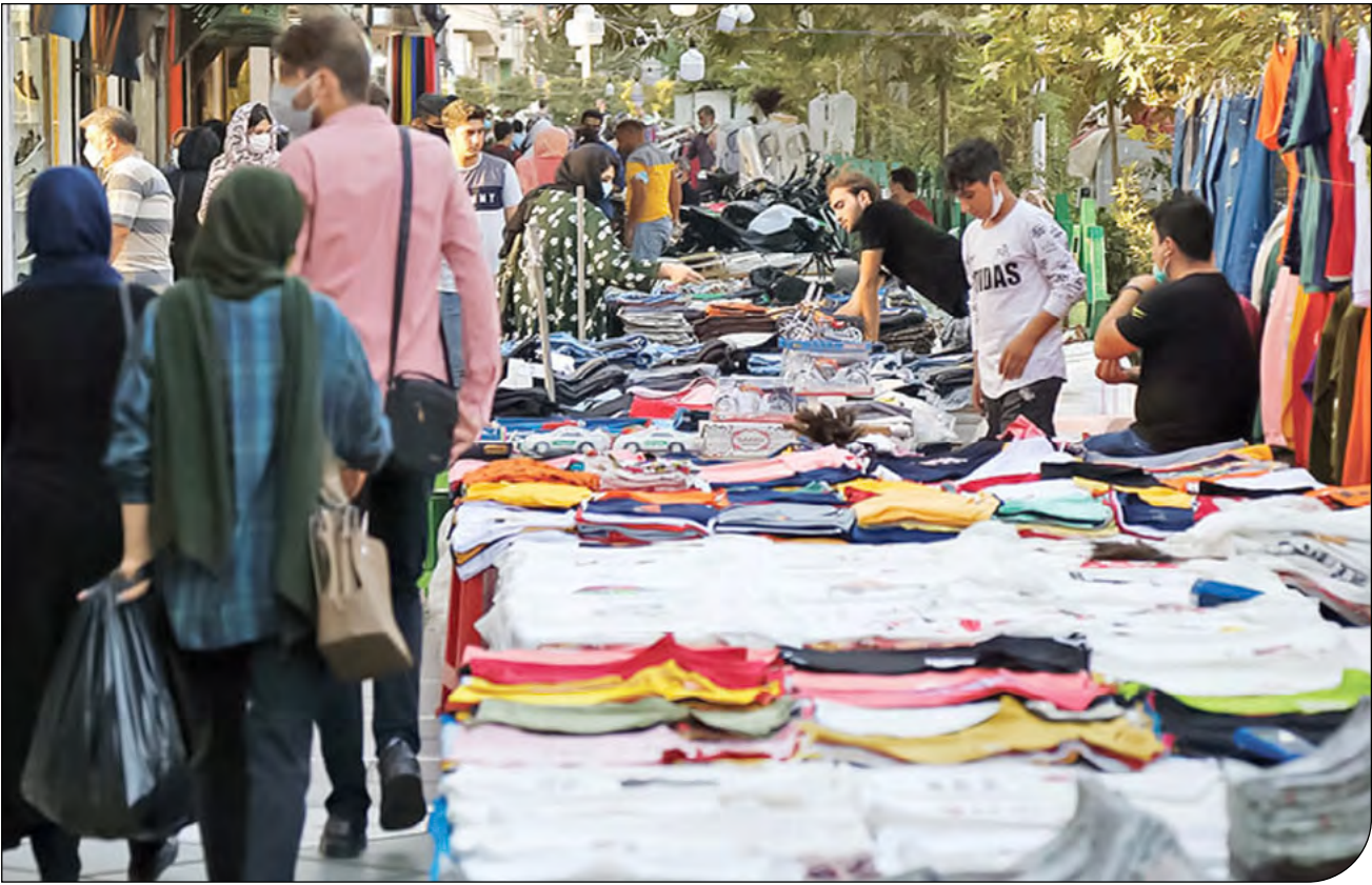
| باشگاه خبرنگاران جوان |