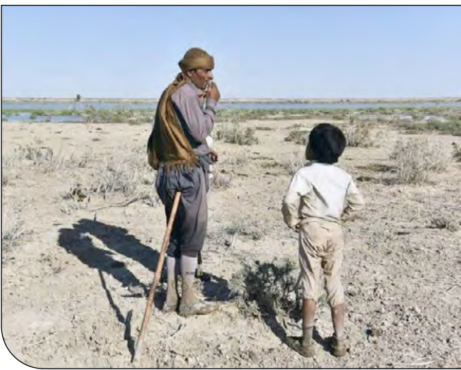
زاهدان به شدت تحت تأثیر منابع آبی چاه‌نیمه است که با قطع آب ورودی از افغانستان، وضعیت چاه‌نیمه‌ها نیز در حال بحرانی است. برخی کارشناسان در اظهار نظرهای غیررسمی، بیان کردند که سطح آب چاه‌نیمه‌ها به رسوب کف رسیده است.

با وجود صرف بودجه برای این پروژه‌های اغلب بی‌نتیجه و یا نیمه‌تمام، تالاب هامون همچنان یکی از بزرگ‌ترین کانون‌های ریزگرد است که در روزهای زیادی از سال، نفس‌های مردم را بریده است. وضعیت اشتغال و معیشت مردمی که شغل آنها در گذشته کشاورزی، دامداری و یا صیادی بوده نیز بسیار تلخ است. موج گسترده مهاجرت از منطقه و روستاهای متروکه، نشانه‌هایی هشدارآمیز از خالی شدن مرزهای جنوب شرقی ایران است که تاکنون هیچ توجهی به آنها نشده است.