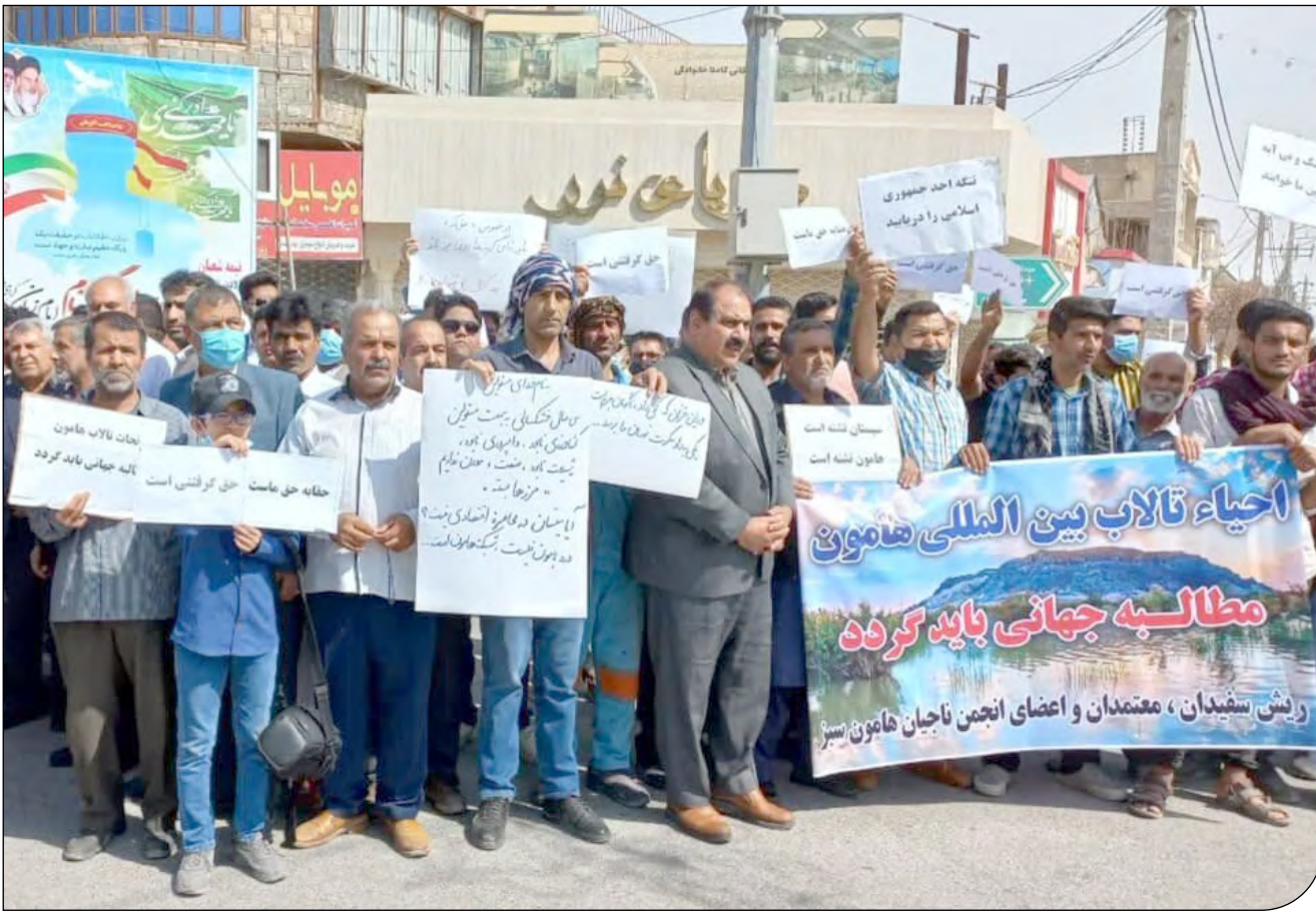
روز جمعه، تصاویر و ویدیوهایی از تجمع اعتراضی گروهی از مردم سیستان در فضای مجاز منتشر شد. مطالبه حبابه هامون از افغانستان، خواسته اصلی شرکت‌کنندگان در این تجمع بود. ظاهراً تجمع با دریافت مجوز از فرمانداری انجام شده و امام جمعه سابق زابل نیز از مردم برای شرکت در این تجمع دعوت کرده بود. نماینده زابل نیز در بین مردم حضور داشت و سخنرانان نیز سعی داشتند این تجمع را مسیری جدا از اعتراضات چند ماه اخیر در کشور نشان دهند. مردم سیستان چند دهه است درگیر خشکسالی تالاب هامون و عواقب آن در بخش‌های اقتصادی و محیط زیستی زندگی خود هستند و سکوت آنها همواره از سوی دولت‌ها با تعبیری مانند صبوری یا نجات مورد تحسین قرار می‌گرفت.

ضوابط و قواعد بین‌المللی رودخانه‌های مرزی رعایت نمی‌شود و حبابه دریافتی، یا سرریز سدها بوده یا به شکل سیلاب به تالاب وارد شده است