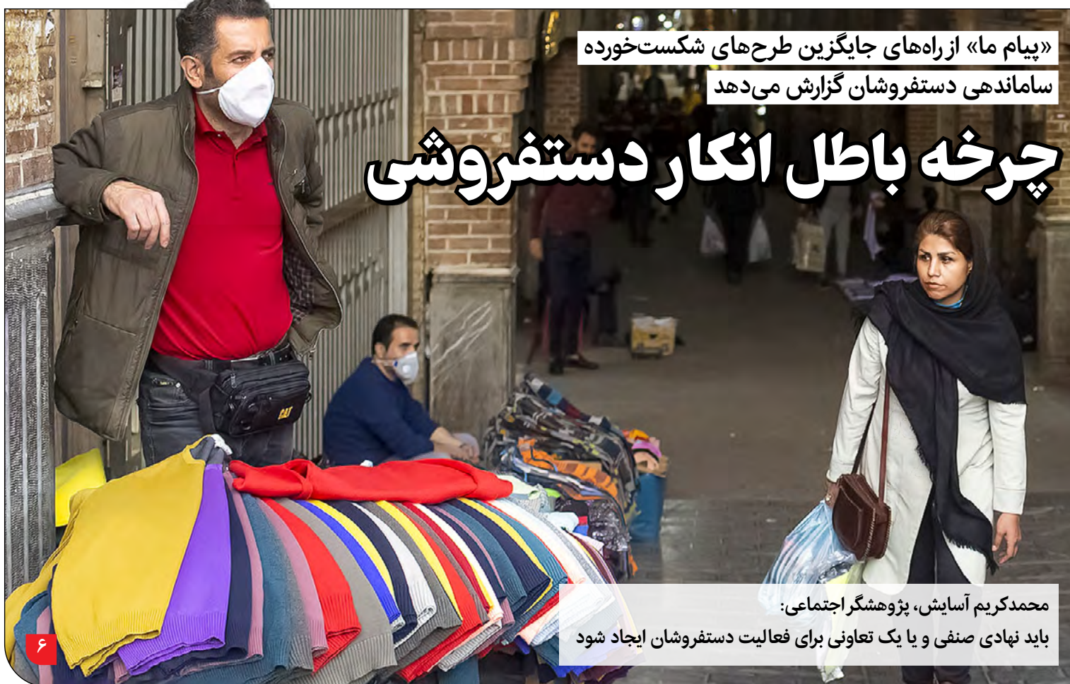
«پیام ما» از راه‌های جایگزین طرح‌های شکست‌خورده ساماندهی دستفروشان گزارش می‌دهد