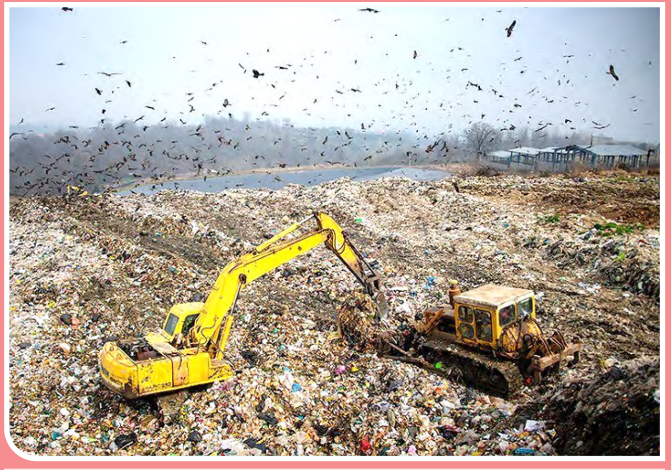
دپوی زباله در بابل کنار - روستای انجیل‌سی در جنوب شهرستان بابل واقع است که روزانه صدها تن زباله به‌صورت غیربهداشتی در این منطقه دفن می‌شود و دهن غیربهداشتی زباله در این منطقه سبب بروز مشکلات زیادی برای اهالی این روستا و روستاهای همجوار شده است.