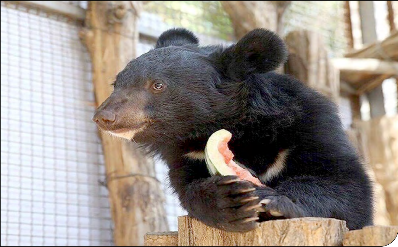
— ۳۰ —

یک دامپزشک حیات وحش: موفقیت ما در نجات، درمان و بزرگ کردن لالین این فرصت را در اختیار سازمان حفاظت محیط زیست قرار داده که به این بهانه، مرکز اختصاصی خرس سیاه بلوچی که ده‌هاست نیازمند آن هستیم تاسیس شود