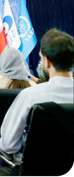
رئیس‌جمهور ایران در نشست خبری مشترک رئیس سازمان انرژی اتمی ایران و مدیرکل آژانس بین‌المللی انرژی