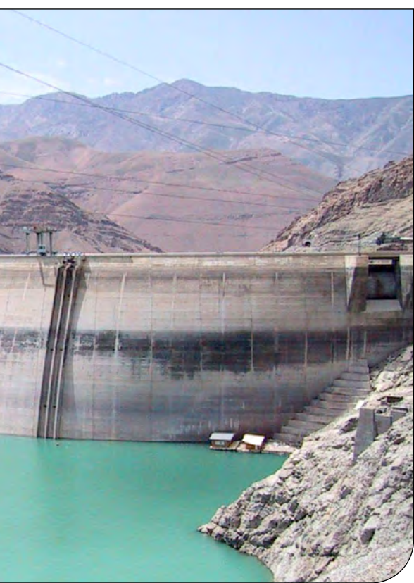
— ۳ —

او ادامه داد: شوینده‌های شیمیایی هر چند باعث پاکیزگی می‌شود اما استفاده نادرست از این مواد در کوتاهمدت آسیب جدی به سلامت انسان و محیط زیست وارد می‌کند. این مواد در چرخه استفاده از آب‌های خاکستری باقی می‌ماند و می‌تواند به محیط‌های مختلف مانند زمین‌های کشاورزی وارد شود. وجود مواد شیمیایی در آب فرایند تصفیه فاضلاب را با مشکل مواجه می‌کند بنابراین تا حد امکان از این شوینده‌های شیمیایی کمتر استفاده و مواد طبیعی همچون سرکه، جوش شیرین و... -که خاصیت پاک‌کنندگی دارند- را جایگزین شوینده‌های شیمیایی کنیم.