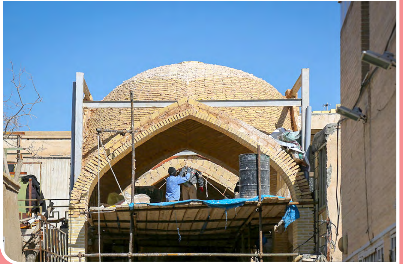
احیای بازار تاریخی حسن‌آباد - بازار تاریخی حسن‌آباد با مرمت تعدادی از طاق‌های آسیب‌دیده، احداث ۲۰ طاق سنتی بازار حسن‌آباد، احداث ۲۰ طاق حسینیه گلبدان، کف‌سازی گذرهای شرقی میدان امام(ره) و احیای بدنه شرقی میدان امام(ره) با هزینه‌ای بالغ بر ۱۷۰ میلیارد ریال به همت سازمان نوسازی و بهسازی شهرداری اصفهان در حال انجام است.