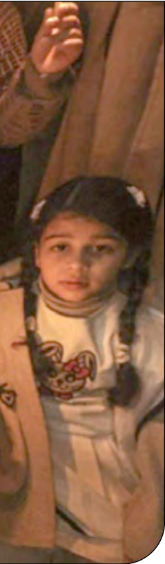
— ۱۴ — [۱]

اتحادیه اروپا سی و یک تیم نجات و پنج تیم پزشکی از ۲۳ کشور عضو را به ترکیه و سوریه اعزام کرد، به ترتیب ۳ میلیون یورو و ۳/۵ میلیون یورو به ترکیه و سوریه متعهد شد و کنفرانس اهداتندگان را برای جمع‌آوری پول اعلام کرد. برنامه اروپایی کوپرنیک نیز برای ارائه خدمات نقشه برداری اضطراری و کمک‌های دیگر برای مدیریت بحران فعال شد. بنس استولنتبرگ، دبیرکل سازمان پیمان آتلانتیک شمالی (ناتو) گفت که کشورهای عضو درحال بسیج حمایت هستند. از قابلیت حمل و نقل هوایی راهبردی ناتو برای حمل و نقل تجهیزات جستجو و نجات استفاده شد. ناتو برای اسکان آوارگان در ترکیه «تاسیسات پناهگاه نیمه دائمی کاملا مجهز» مستقر کرده است. سازمان ملل متحد (سازمان ملل متحد) چندین آژانس سازمان ملل متحد، از جمله، UNHCR، OCHA، UNICEF و IOM، واکنش‌های هماهنگ به این فاجعه را اعلام کردند. مدیر منطقه‌ای سازمان جهانی بهداشت برای اروپا، هانس کلوگه، گفت که دفاتر منطقه‌ای این سازمان به تلاش‌های بین‌المللی برای حمل دارو و تجهیزات امدادی کمک می‌کنند. سازمان ملل ۲۵ میلیون دلار از صندوق اضطراری خود برای کمک‌های بشردوستانه در ترکیه و ۲۵ میلیون دلاری برای تلاش‌های امدادی در سوریه اهدا کرد. سازمان ملل از طریق گذرگاه مرزی باب الحوا از طریق ترکیه کمک‌های بشردوستانه به سوریه ارسال کرده است. در ۱۴ فوریه، سازمان ملل درخواست ۳۹۶ میلیون یورو برای کمک به بازماندگان در سوریه کرد. بانک جهانی اعلام کرد ۱/۷۸ میلیارد دلار به ترکیه کمک خواهد کرد تا از روند امداد و بهبودی حمایت کند. ملاحظه می‌شود که برآورد اولیه از خسارت‌ها بسیار زیاد است و کمک‌های بین‌المللی برای جبران درصدی از این آسیب‌ها می‌تواند به کار آید.