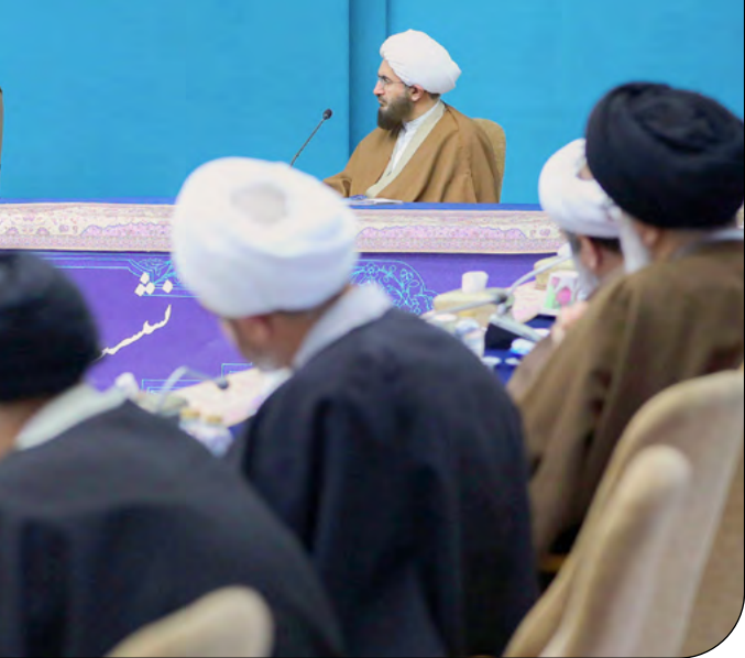
ریاست جمهوری | ۱۳۰۱

بهزاد نبوی اعلام کرد بنا به دلایل جسمی و کهنوت سن از ریاست جبهه اصلاحات کناره‌گیری کرده است. ایلنا در خبری نوشت: بهزاد نبوی در پاسخ به این سوال که آیا تمایل به ادامه همکاری در جبهه اصلاحات را دارد، گفت: به دلیل مشکلات جسمی و همچنین بالا بودن سن دیگر اصلاحات را دارم، گفت: به دلیل مشکلات جسمی و همچنین بالا بودن سن در ریاست جبهه اصلاحات از پایان دوره ریاست دو ساله خود در این جبهه خبر داد. نبوی، رئیس جبهه اصلاحات درباره کناره‌گیری از این مقام گفت: مدت دو ساله من در ریاست جبهه اصلاحات به پایان رسید و دیگر سمتی در جبهه ندارم. او در پاسخ به این سوال که آیا تمایل به ادامه همکاری در جبهه اصلاحات را دارد، گفت: به دلیل مشکلات جسمی و همچنین بالا بودن سن دیگر امکان حضور در جبهه را ندارم.