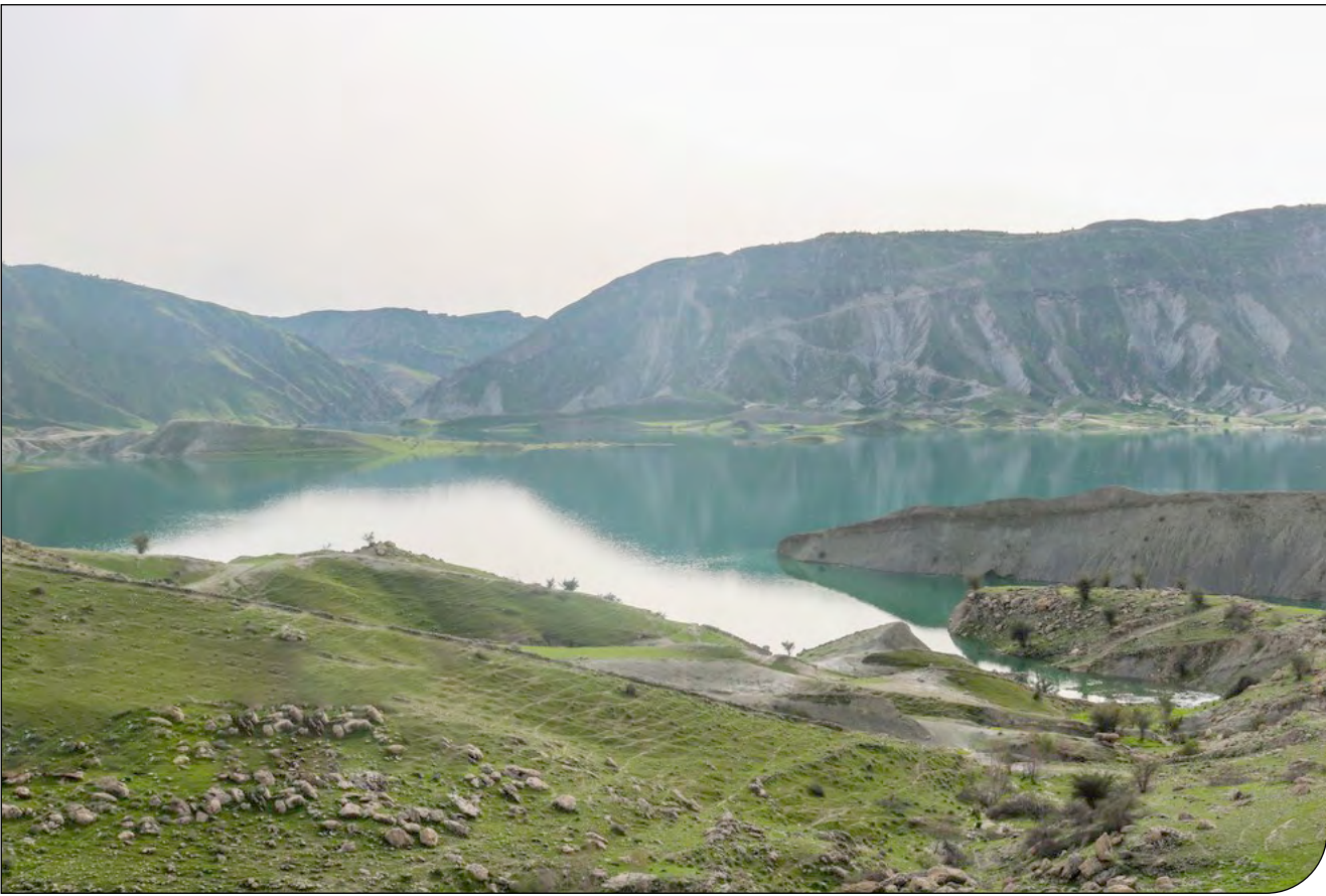
سد چم‌شیر در استان گچساران