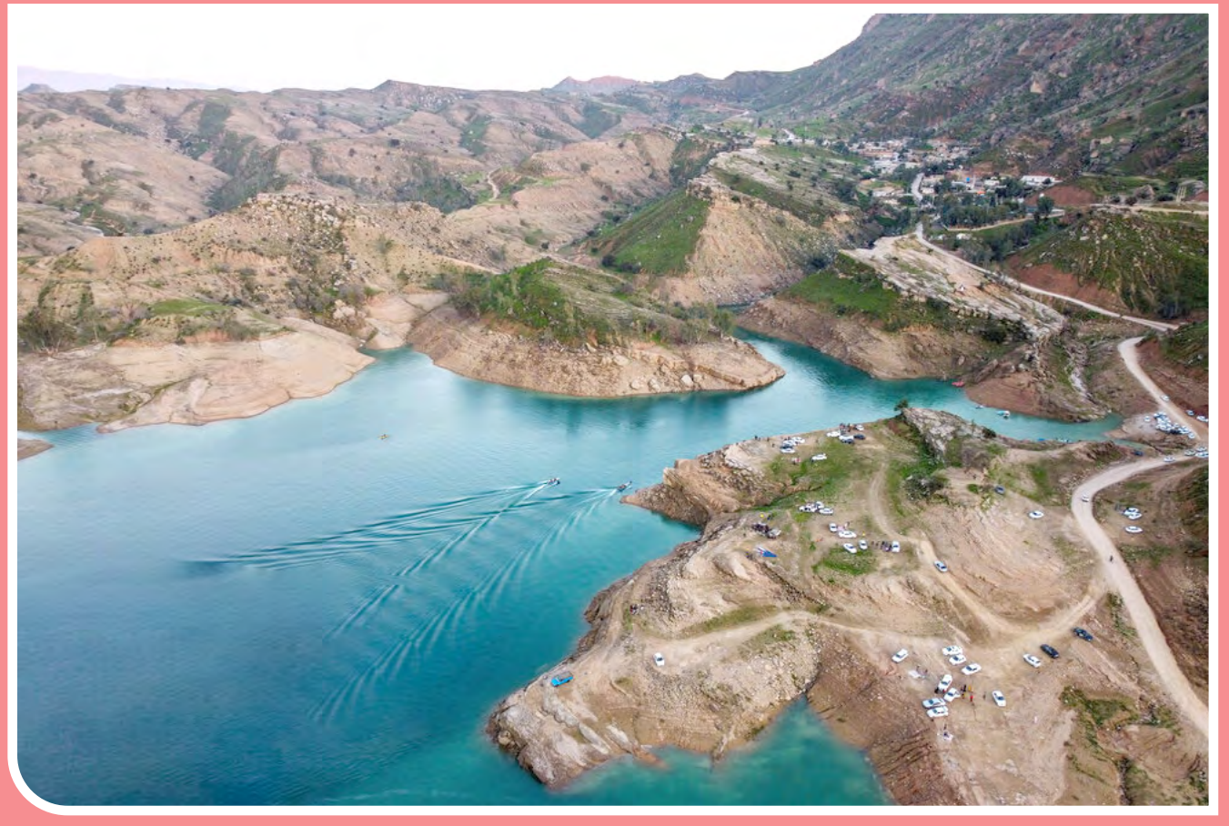
دریاچه شهیون یا دریاچه سد دز، یکی از زیباترین دریاچه‌های ایران است که پشت دو کوه شاداب و تنگوان در کنار روستای گردشگری پامنار دزفول شکل گرفته و چهره‌ای تماشایی به این منطقه داده است. این دریاچه به صورت مصنوعی و با احداث سد دز بر روی رودخانه دز شکل گرفته است. دریاچه شهیون تعدادی جزیره بزرگ و کوچک را در خود جای داده است که زیبایی منحصر به فردی به آن می‌بخشد.