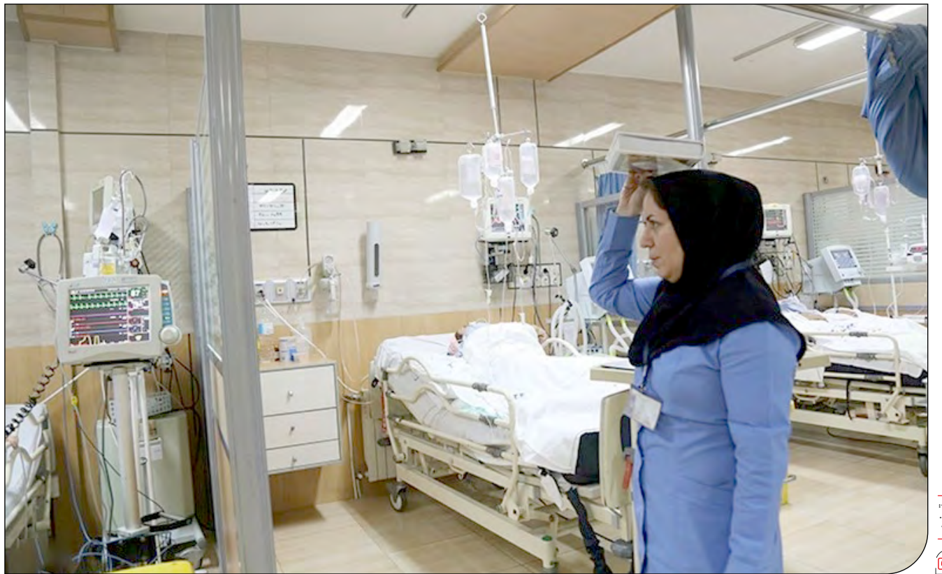
«پیام ما» گزارش مرکز پژوهش‌های مجلس از اعتبارات حوزه درمان را بررسی می‌کند