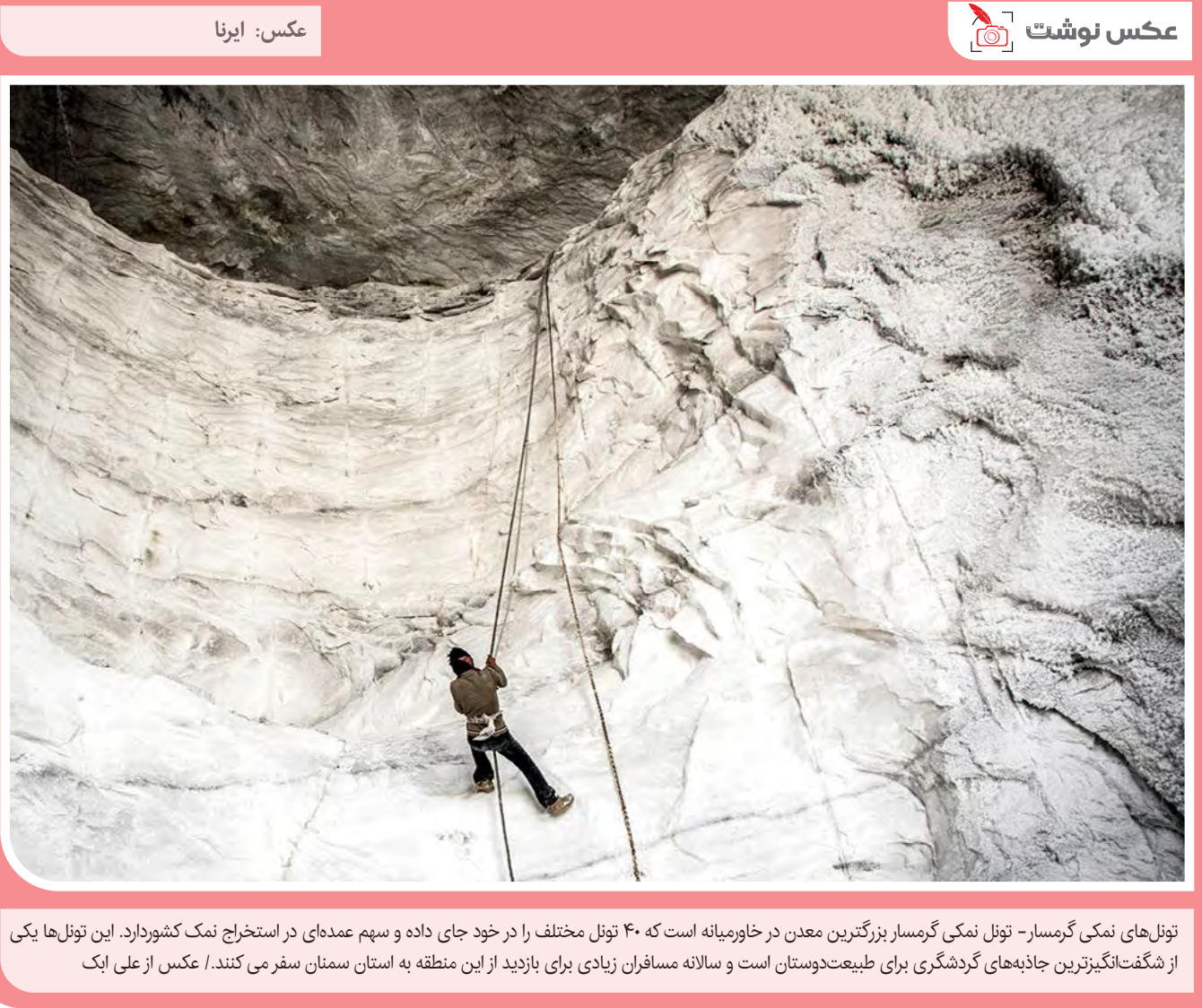
تول‌های نمکی گرمسار بزرگترین معدن در خاورمیانه است که ۴۰ تونل مختلف را در خود جای داده و سهم عمده‌ای در استخراج نمک کشور دارد. این تونل‌ها یکی از شگفت‌انگیزترین جاذبه‌های گردشگری برای طبیعت‌دوستان است و سالانه مسافران زیادی برای بازدید از این منطقه به استان سمنان سفر می‌کنند.