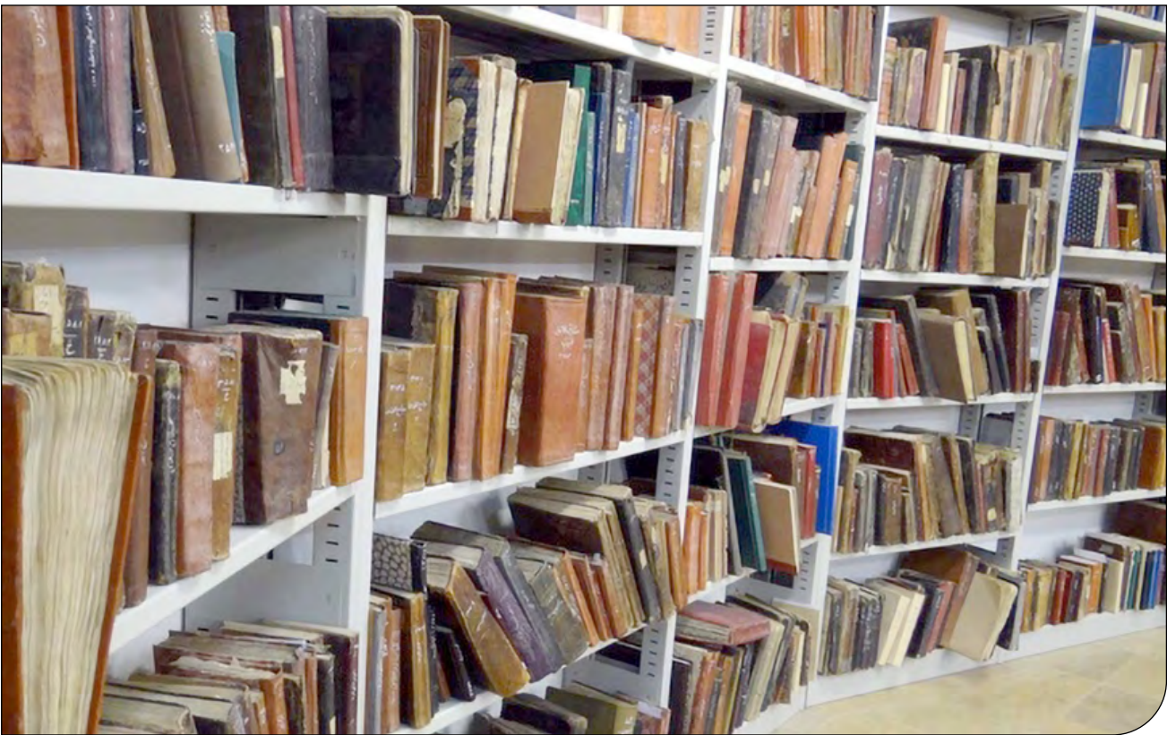
— 141 —