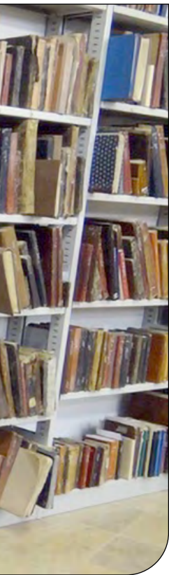
— 141 —

او خاطرنشان کرد: بیش از یک دهه است که شهروندان چشم انتظار تحقق این موضوع به‌عنوان گامی در جهت آزادسازی عرصه ثبت شده درفهرست جهانی هستند. سرپرست میراث فرهنگی شوستر خاطر نشان کرد: تخریب این بنا نه تنها موجب آزادسازی عرصه جهانی سازه‌های آبی‌تاریخی شوستر و ایجاد منظری مناسب برای گردشگران می‌شود بلکه می‌تواند در آینده شرایطی را برای ایجاد محیطی برای ارائه خدمات گردشگری به صورت روزیاز فراهم سازد.