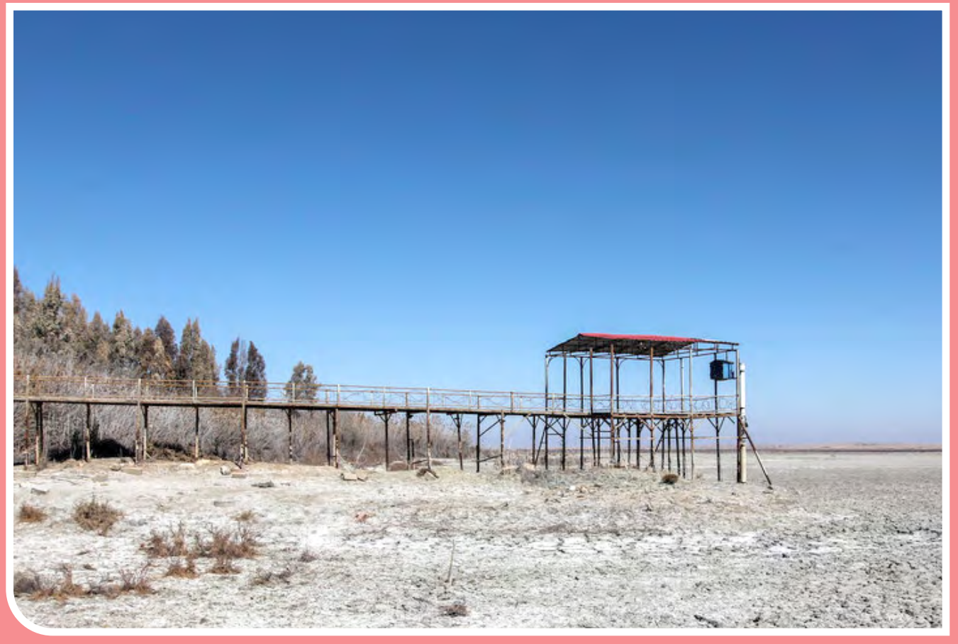
تالاب «آلاگل» در معرض نابودی - مجموعه تالاب‌های «آلاگل»، «آجی‌گل» و «آلاگل» سه تالاب بین‌المللی در شمال گنبدکاووس در استان گلستان و با وسعت سه هزار و ۲۷ هکتار، محل زمستان‌گذرانی پرندگان آبی و کنارآبی است که از شمال سیبری به این تالابها مهاجرت می‌کنند. اکنون تالاب بین‌المللی آلاگل در بهمن ۱۴۰۱ به طور کلی خشک شده و عاری از هر گونه آب، پرند و آبی است.