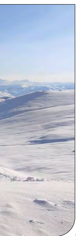
پاسرخشیدی پیام ما

او با بیان اینکه برابر اعلام پلیس راهور میزان خودروهای تردد کننده در تهران، ۸ برابر معابر است که بخش عمده‌ای از این خودروها فرسوده هستند، ادامه داد: پس به طور طبیعی حرکت در تهران به سختی خواهد بود و آلودگی هوا نیز افزایش خواهد یافت و اگر نتوانیم مسئله ترافیک را حل کنیم، موضوع آلودگی هوا نیز حل نخواهد شد به همین دلیل ما اصرار داشتیم که در برنامه چهارم توسعه شهرداری تهران چند موضوع محوری همچون حل مسئله ترافیک، با توسعه حمل و نقل عمومی است. امانی با بیان اینکه یکی از اعضای شورای شهر در تذکری اعلام کرد که تنها ۸۰ میلیارد تومان برای آلودگی هوا به تهران اختصاص داده شده است که فقط می‌شود چند متر مترو با این پول ساخت، گفت: با این پول نمی‌شود مشکل تهران را حل کرد و ما در آن نامه گفتیم که سران سه قوه باید طریحی نو ارائه دهند وگرنه مشکل آلودگی هوای پایتخت و ترافیک با این روش‌ها حل نمی‌شود. او در مورد سرانجام نامه اعضای شورا به سران قوا گفت: رئیس جمهور نامه را به ۵ وزارتخانه ارجاع دادند؛ اما این ارجاع باید اقدام عملی داشته باشد و انتظار داشتیم این دستور در بودجه ۱۴۰۲ خود را نشان دهد که نداد، چرا که وقتی بودجه به مجلس رفت، مجلس هم نمی‌تواند برابر قانون به ساختار بودجه دست ببرد و بیش از منابعی که دولت در نظر گرفته، اعتبار پیش بینی کند.