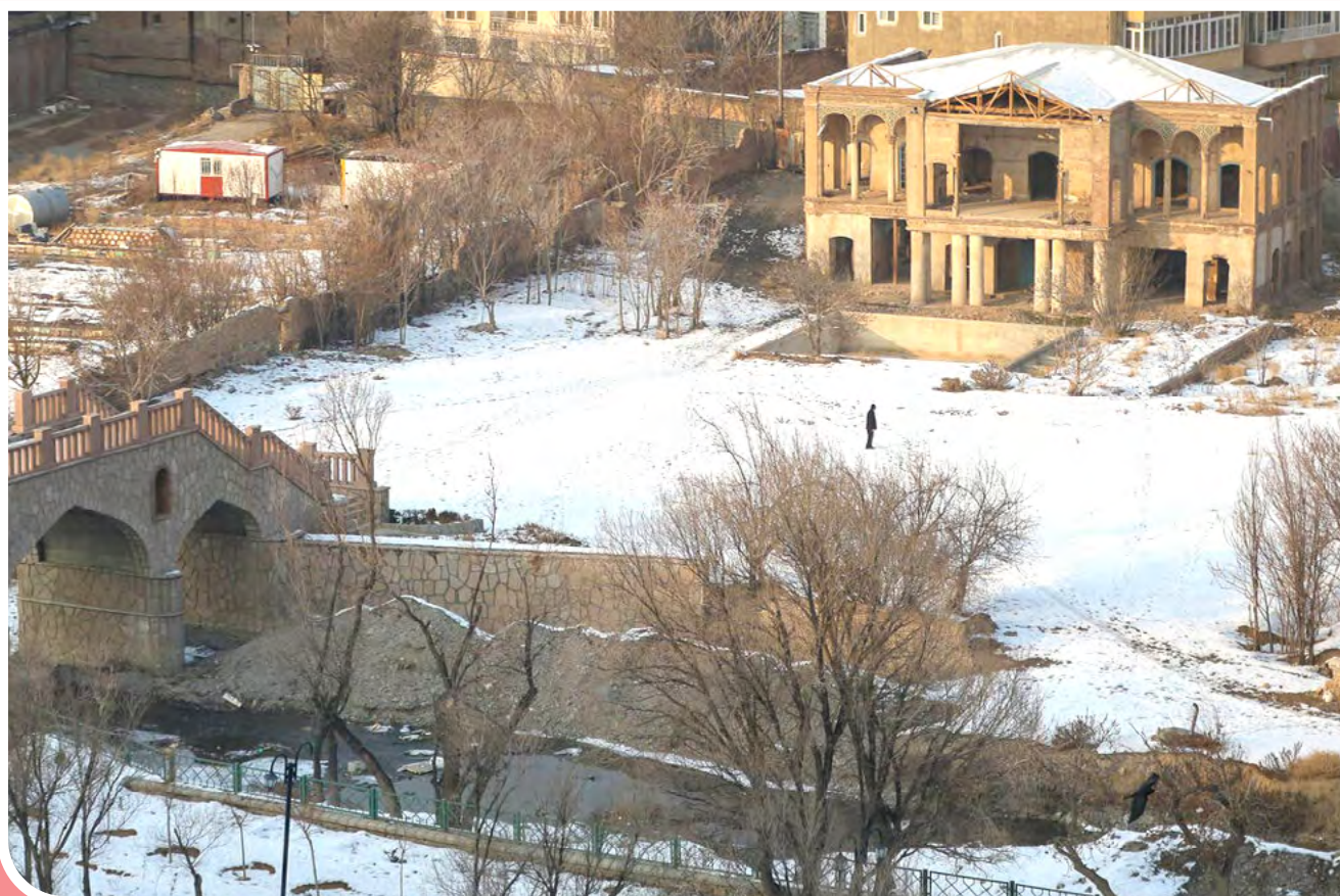
وضعیت نابسامان خانه تاریخی کلانتری تبریز - خانه تاریخی کلانتری متعلق به دوره قاجار است و در منطقه بیلانکوه تبریز واقع شده است این خانه سال‌ها کاربری مدرسه داشت و پس از آن چند سال متروک ماند تا در سال ۱۳۹۸ توسط اداره کل میراث فرهنگی، گردشگری و صنایع دستی و آموزش و پرورش آذربایجان بخش‌هایی از این بنا را مرمت کردند اما دوباره به حال خود رها شد. خانه تاریخی کلانتری در سال ۱۳۸۲ در فهرست آثار ملی ایران ثبت شده است.