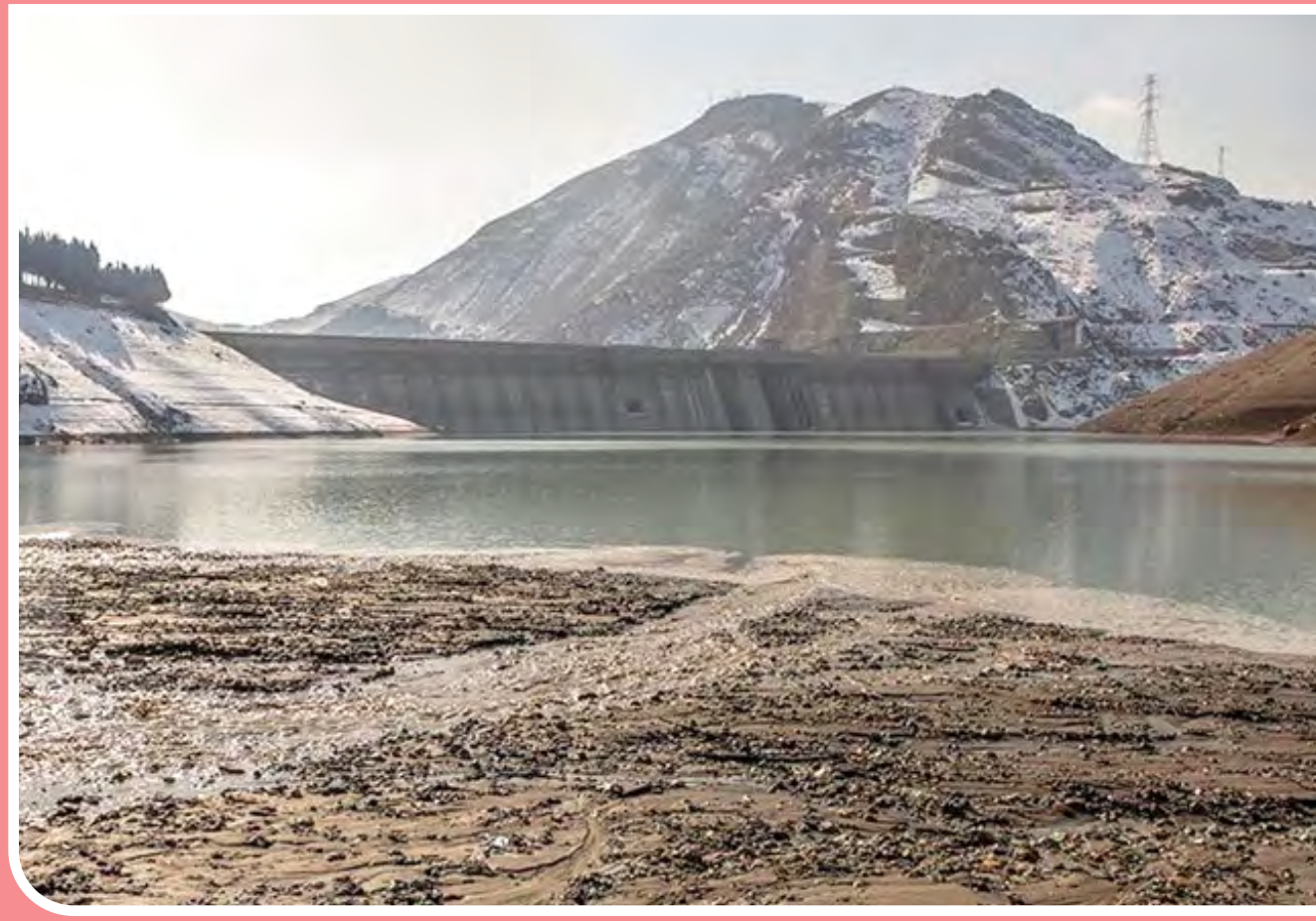
وضعیت بحرانی ذخیره آب پشت سد لتیان - حجم آب سد لتیان که آب شرب شرق تهران و آب کشاورزی دشت ورامین را تامین می‌کند به ۱۲ میلیون متر مکعب رسیده و نسبت به سال گذشته ۵ میلیون متر مکعب کاهش پیدا کرده است. با خشک شدن رودخانه‌های لوارک و جاجرود میزان ورودی آب به این سد هم به دو متر در ثانیه رسیده است.