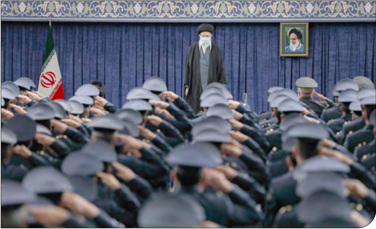
— Rhamane.ir —