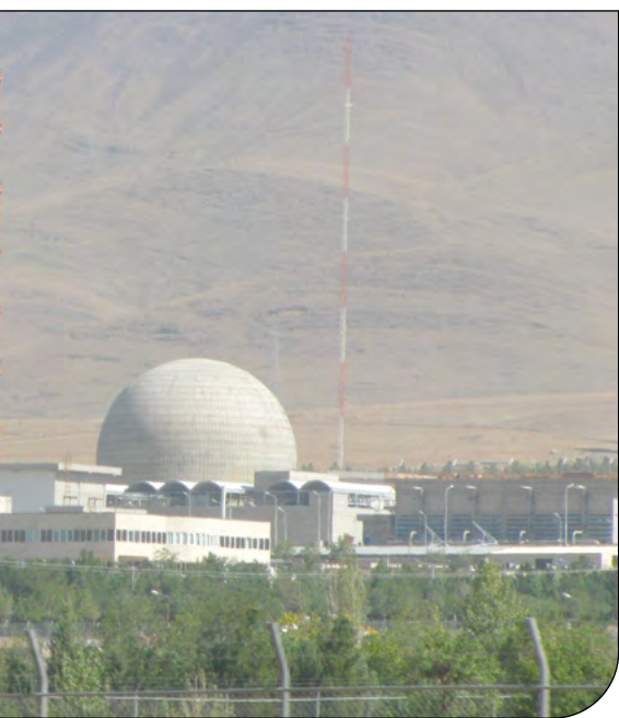
— مهرشهری —