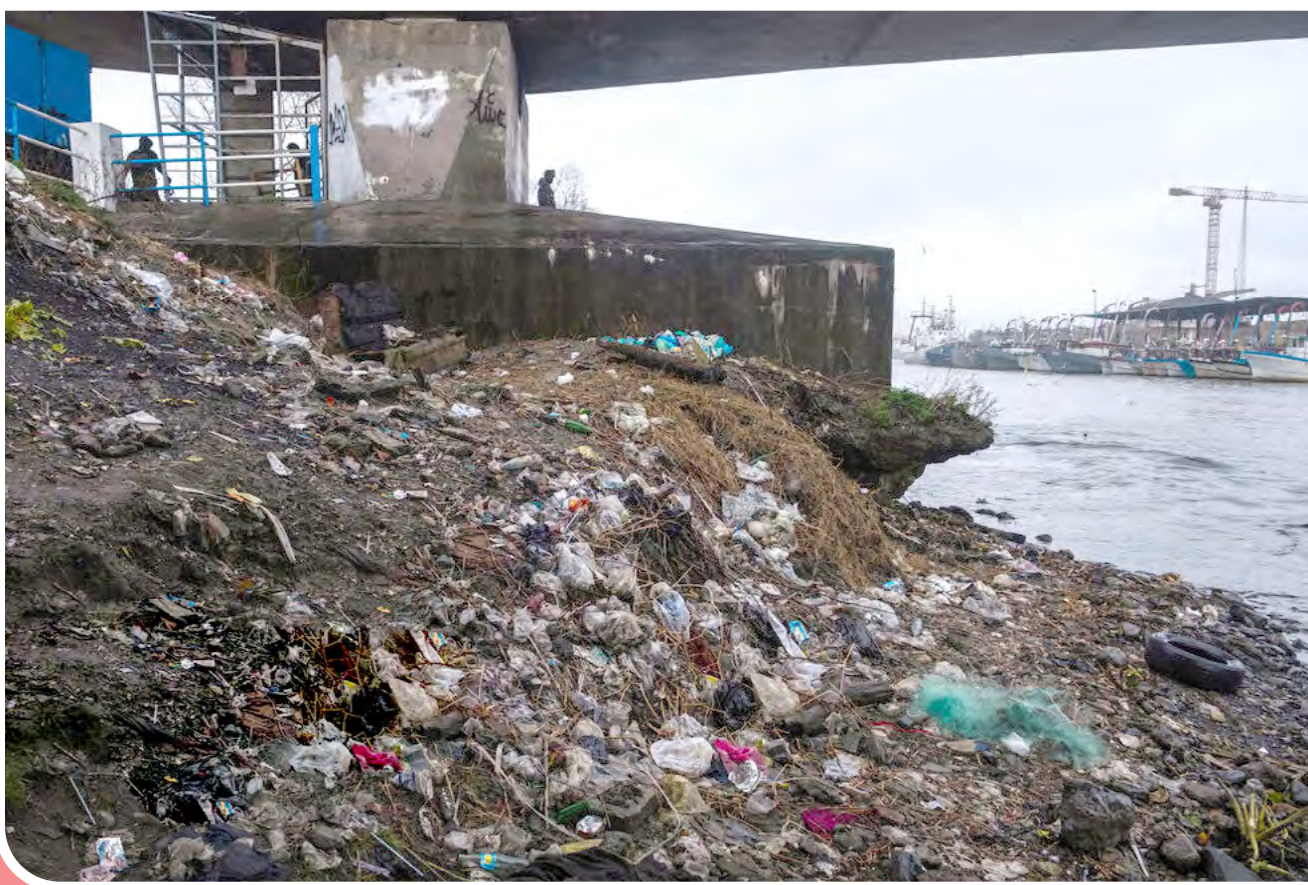
تالاب یا مرداب انزلی با مساحتی نزدیک به ۲۰ هزار هکتار، واقع در جنوب غربی ساحل دریای خزر، از بزرگترین و مهمترین تالاب‌های ایران با داشتن ویژگی‌های منحصر به فرد است. در سال‌های اخیر این تالاب مهم با مشکلات فراوانی مواجه شده است. از جمله مشکلات این تالاب می‌توان به کاهش شدید عمق این تالاب، حمله گیاه مهاجم سنبل آبی، ورود انواع فاضلاب صنعتی، خانگی و بیمارستانی و افزایش سطح انباشت رسوبات اشاره کرد.