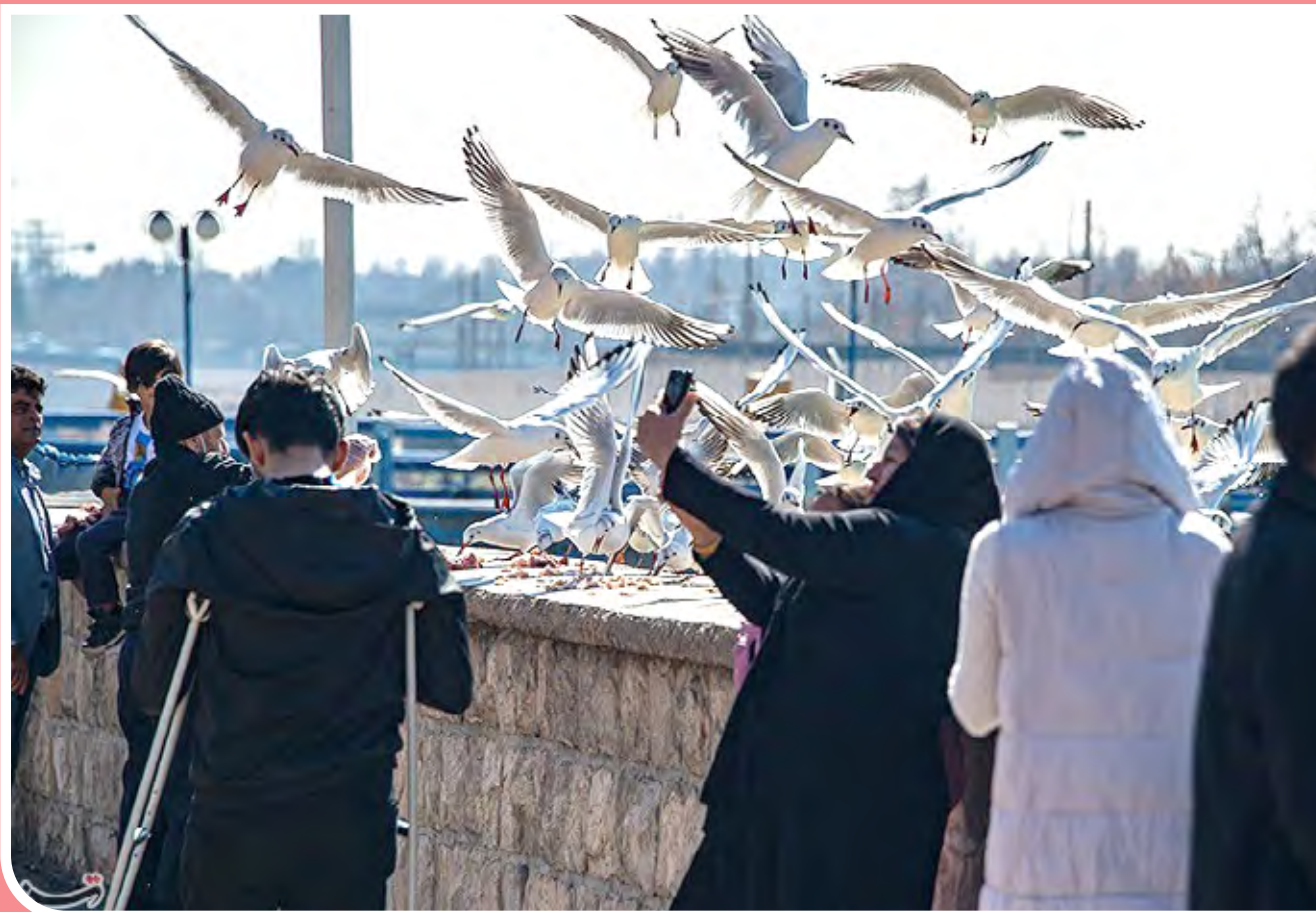
مرغان کاکایی در نهر اعظم شیراز - با پایان یافتن فصل پاییز و شروع فصل سرما، با توجه به اینکه شهرستان شیراز و فارس به لحاظ آب و هوایی شرایط معتدل را دارد، مرغان دریایی سبیری با نام مرغان کاکایی، میهمانان ناخوانده هر سال شیراز می‌شوند و جلوه زیبایی را به باغ شهری چمران و نهر اعظم شیراز می‌دهند.