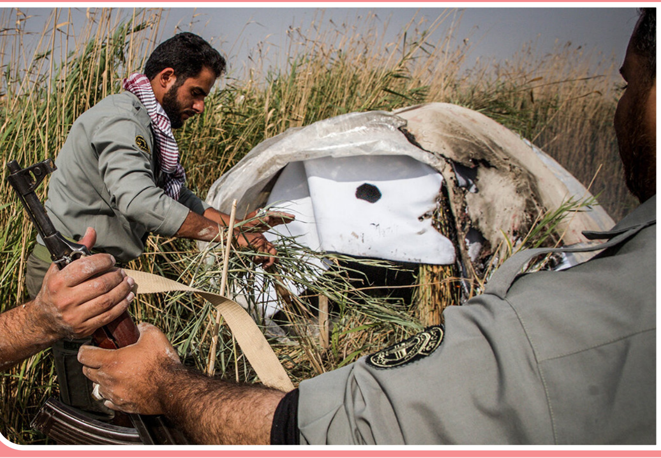
دامگاه- تالاب هورالعظیم با ۱۲۵ هزار هکتار مساحت بزرگترین و شناخته شده‌ترین تالاب بین‌المللی ایران است که هر ساله بالاترین جمعیت پرندگان مهاجر در آن ثبت می‌شود. با آغاز فصل مهاجرت، تب شکار غیرمجاز پرندگان در بین شکارچیان بالا گرفته و آنان دامگاه‌هایی را در مناطق پرتردد این تالاب برپا می‌کنند. نیروهای یکان حفاظت محیط زیست که به نگهداران تالاب شهرت دارند عملیات گشت و تخریب دامگاه و محمیبه‌های شکارچیان را دنبال می‌کنند