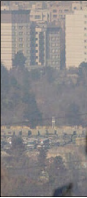
ایستادگی در برابر اعتراضات

مخالفان با استناد به آمار عوارض آلودگی و نیز تحقیقات معتبر داخلی و بین‌المللی در خصوص عوارض آلودگی هوا به‌ویژه در کودکان، با این ایده مخالفت کرده‌اند. مرکز اطلاع‌رسانی وزارت کشور با اشاره به اینکه تعطیلی مدارس در گام نخست با هدف حراسات از سلامت دانش‌آموزان است و به‌صورت مستقیم ارتباطی با کاهش آلودگی هوا ندارد، تجربه دیگر کشورها از جمله هند و چین را مثال زده و در نهایت می‌گوید: «هر کشوری متناسب با شرایط خود، استاندارد و سیاست‌گذاری‌های مختلفی را برای حل این چالش اعم از تعطیلی مدارس و مشاغل برای افراد و گروه‌های حساس جامعه در پیش می‌گیرند و یک راه حل جهانی برای آن وجود ندارد.» مرکز اطلاع‌رسانی وزارت کشور در ادامه با اشاره به اینکه با توجه تاثیرگذاری معنادر آموزش حضوری، سیاست‌گذاری‌ها باید معطوف به حضور مداوم دانش‌آموزان در کلاس‌های درس باشد، ادامه می‌دهد: «تلاش برای تغییر استاندارد آلودگی هوا به مفهوم بی‌توجهی به اجرای قانون هوای پاک نیست. مصوبات این قانون به صورت مستمر و ماهیانه با حضور دستگاه‌های ذی‌ربط با راهبری وزارت کشور در حال پیگیری است.