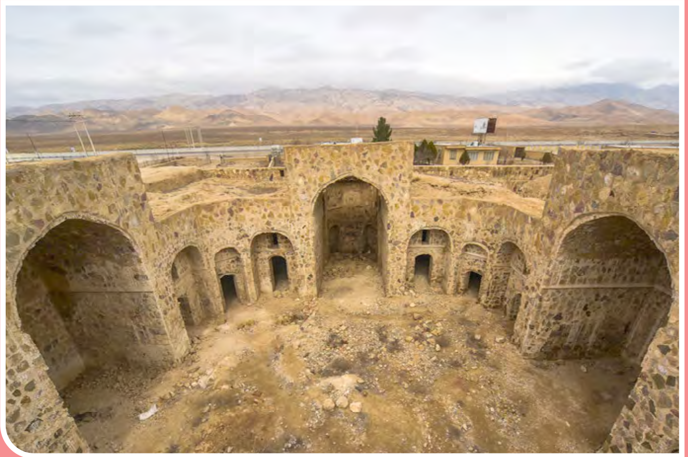
کاروانسرای تاریخی رباط قره بیل - کاروانسرای تاریخی «رباط قره بیل» باقی‌مانده از دو دوره تیموریان و صفویان، در شهرستان «گرمه» از توابع استان خراسان شمالی در روستای «قره بیل» قرار گرفته است. قدمت بنای نخست این اثر تاریخی به احتمال زیاد، به قرن چهارم و پنجم هجری می‌رسد، بنایی که در متون تاریخی از آن به نام «رباط املوتلو» یاد می‌شود. این بنای تاریخی که در یازدهم دی ۱۳۸۰ به‌عنوان یکی از آثار ملی ایران به ثبت رسیده است،