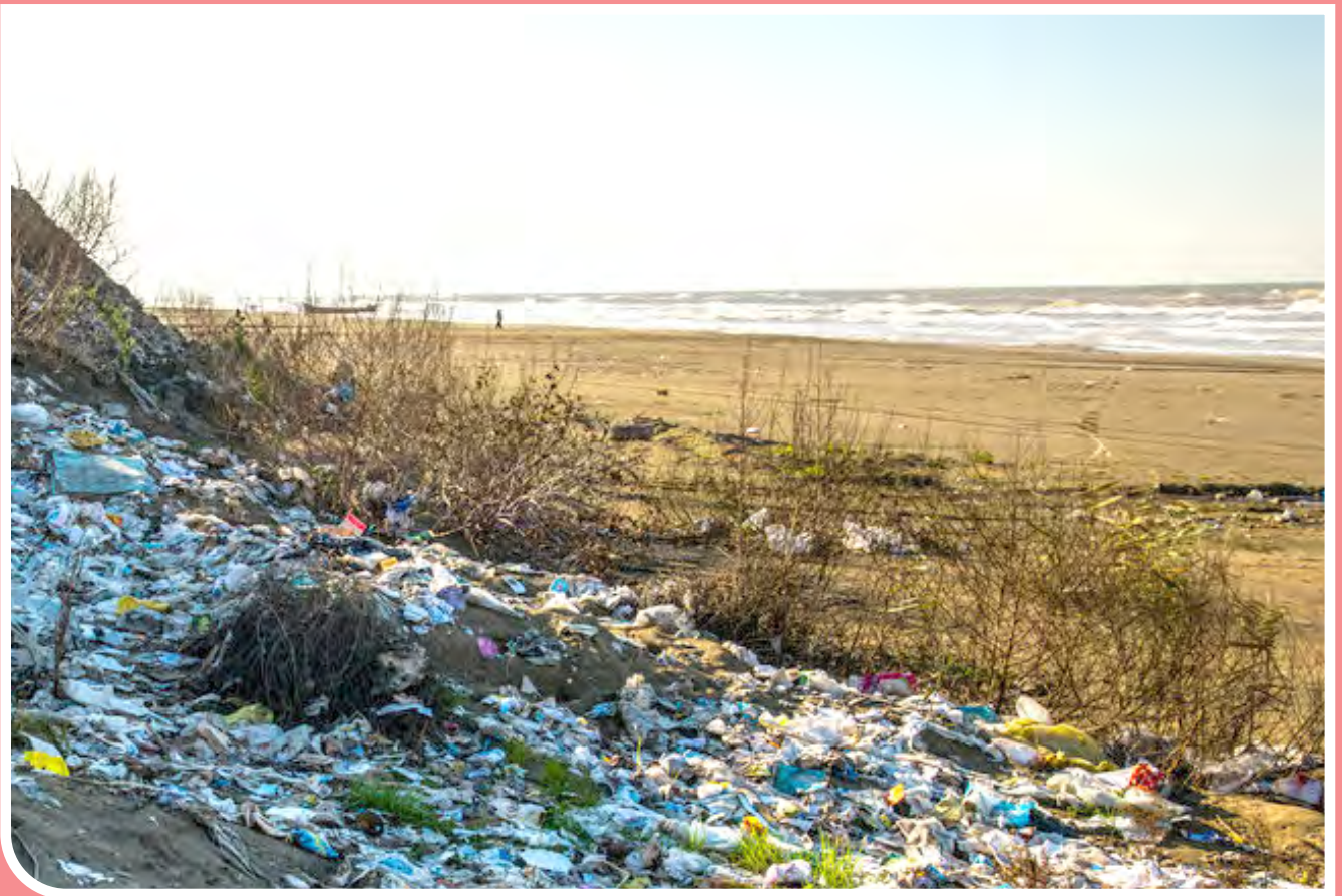
احوال بد ساحل محمودآباد - محمودآباد یکی از قطب‌های گردشگری استان مازندران است، منطقه‌ای ساحلی که همین خصوصیات باعث تولید زباله بیشتر در این منطقه شده است. در حال حاضر زباله‌ها در فاصله کمتر از ۲۰ متری ساحل در میان ساختمان‌های مسکونی، اداری و ویلاهای تفریحی جمع‌آوری می‌شود. این شرایط، مشکلات محیط زیستی زیادی را برای مردم منطقه ایجاد کرده است. بوی زباله تا شعاع یک کیلومتری از منطقه کاملاً حس و شیرابه حاصل از دیوی غیراصولی زباله وارد دریای خزر می‌شود.