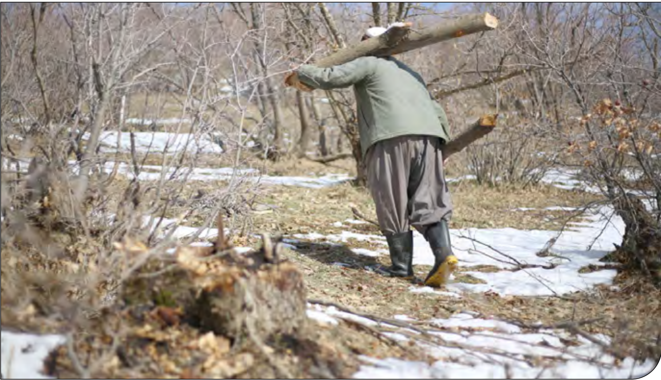
— زغال —

روزانه در کشور فقط برای مصرف قلیان ۳ هزار تن زغال استفاده می‌شود که برای این تعداد باید ۹ هزار درخت قطع شود. همچنین دو برابر این مقدار زغال با عنوان زغال کبابی استفاده شده که یعنی ۱۸ هزار درخت هم برای تامین این میزان زغال قطع می‌شود