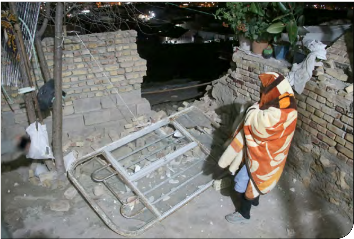
میثا توچی - پیام ما | [6]

«پیام ما» از آخرین وضعیت زلزله‌زدگان آذربایجان غربی گزارش می‌دهد