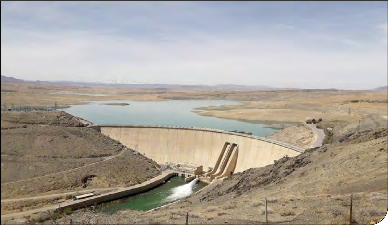
وزارت نیرو از وضعیت ذخیره ۱۷ سد مهم آب شرب و کشاورزی گزارش داده است

او در عین حال افزود: با تیم‌های مختلف تولید گاز در هر سکو را متوقف می‌کنیم و بعد از انجام تعمیرات، آماده تولید حداکثری در زمستان هستیم.