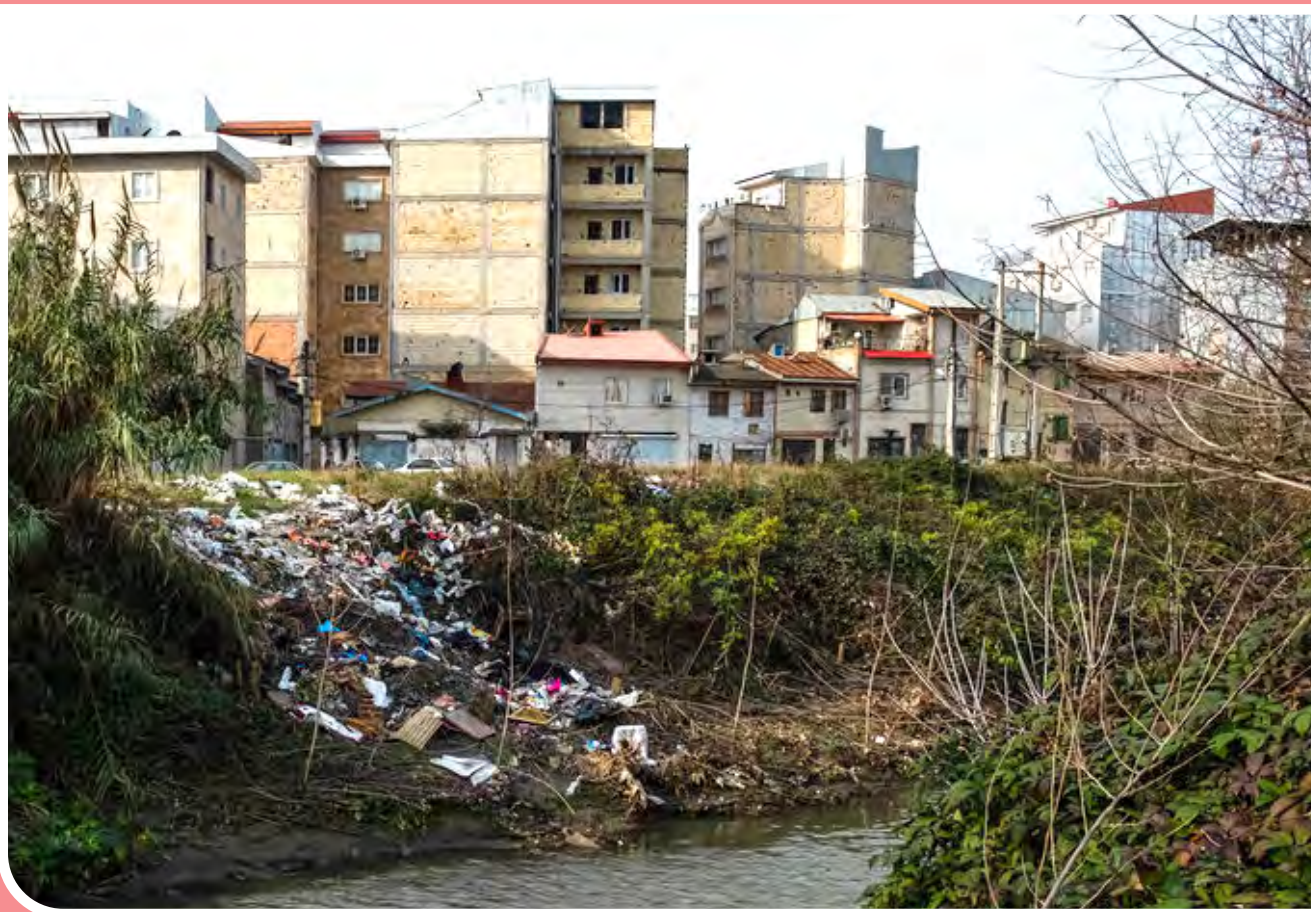
رودخانه‌های رشت میزبان فاضلاب و زباله - سرازیر کردن فاضلاب‌های خانگی و بیمارستانی به رودهای «زرچوب» و «گوهر رود» از یک سو و رها کردن زباله‌ها در حاشیه این رودها از سوی دیگر باعث شده تا فضای آلوده‌ای برای ساکنان این مناطق به وجود آید.