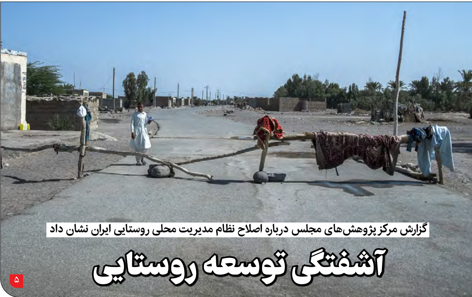
گزارش مرکز پژوهش‌های مجلس درباره اصلاح نظام مدیریت محلی روستایی ایران نشان داد

چگونه می‌توان به مسئله پیچیده صرفه‌جویی در مصرف آب پرداخت؟ این سوالی است که مجمع جهانی اقتصاد در تازه‌ترین گزارش خود به آن پاسخ داده است. اکوسیستم‌های آب شیرین، مانند رودخانه‌ها و دریاچه‌ها، رگ حیاتی سیاره ما