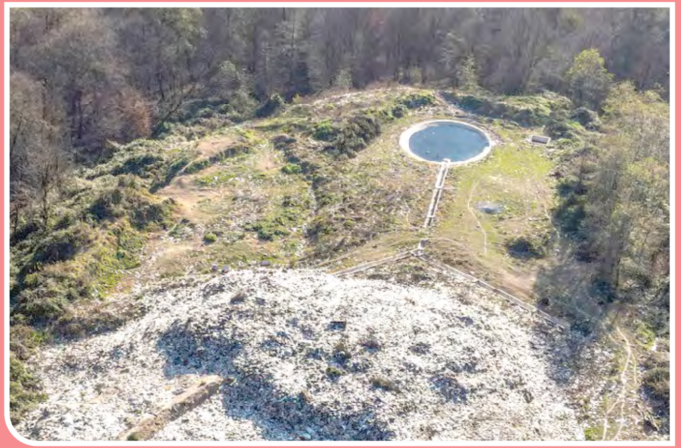
دیوی زباله در «زیراب» - «زیراب» یکی از شهرهای شهرستان سوادکوه در استان مازندران است که ماشین‌های حمل زباله شهرداری، روزانه چیزی حدود ۲۷ تن زباله را از مسیر منطقه «چندلا» به سمت بهمنان و از یک جاده فرعی وارد جنگل‌های ثبت جهانی شده هیرکانی می‌کنند. هر چند این حجم از زباله فقط متعلق به شهرستان «زیراب» نیست، اما با این وجود برخی از روستاهای اطراف این شهر، به عنوان محل دیوی زباله، انتخاب شده‌اند.