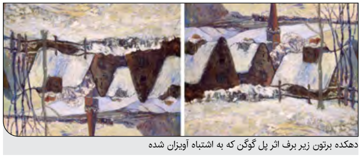
دهکده برتون زیر بر اثر ریل گوگن که به اشتباه آویزان شده

هنر گاهی می‌تواند گیج‌کننده باشد؛ به‌خصوص در غیاب شخص هنرمند که ممکن است اطرافیان او یا حتی متصدیان موزه را به اشتباه بیادازد و جهت درست نصب آثار قابل تشخیص نباشد. به گزارش هنرانلاین، برخی از مشهورترین آثار حتی مجرب‌ترین متصدیان موزه‌ها را به اشتباه انداخته و باعث شده به طور ناخوسته آثار به اشتباه نمایش داده شوند. یکی از آثار گوگن پس از مرگ او در سال ۱۹۰۳ در یک حراجی در تاهیتی فروخته شد. به گفته ویکتور سگان، یکی از دوستان هنرمند که در این فروش حضور داشت، حراج‌گذار نقاشی را وارونه ارائه کرد و آن را «آبشار نی‌گارا» نامید. سگان تابلو را به مبلغی معادل چند پنی خرید